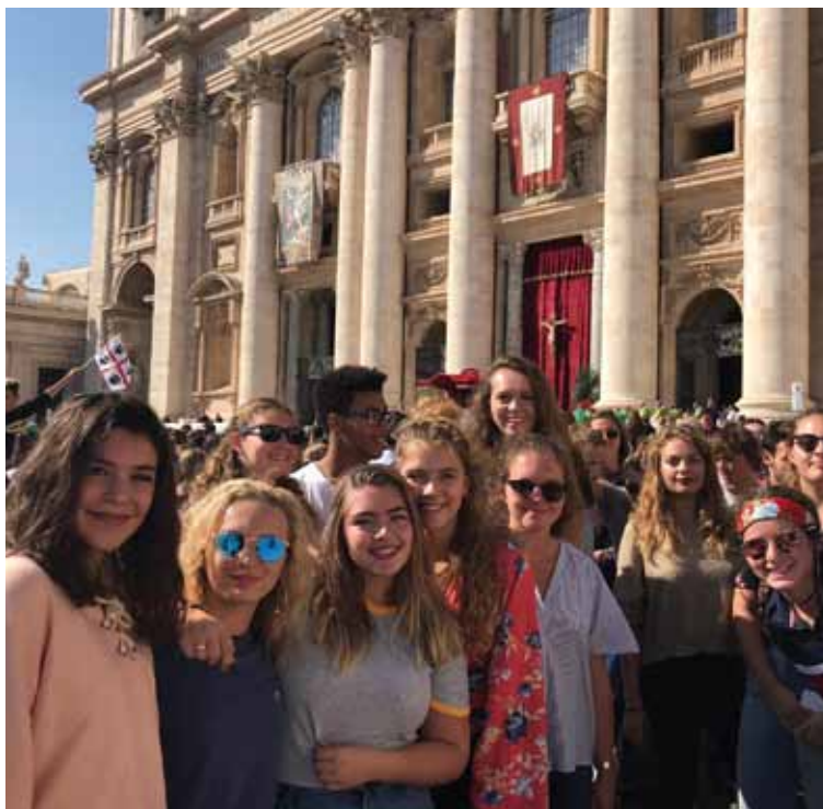
Un grupo de jóvenes participantes en la Santa Misa de Apertura del Sínodo.

Después de haber dado una «cálida bienvenida» a los dos