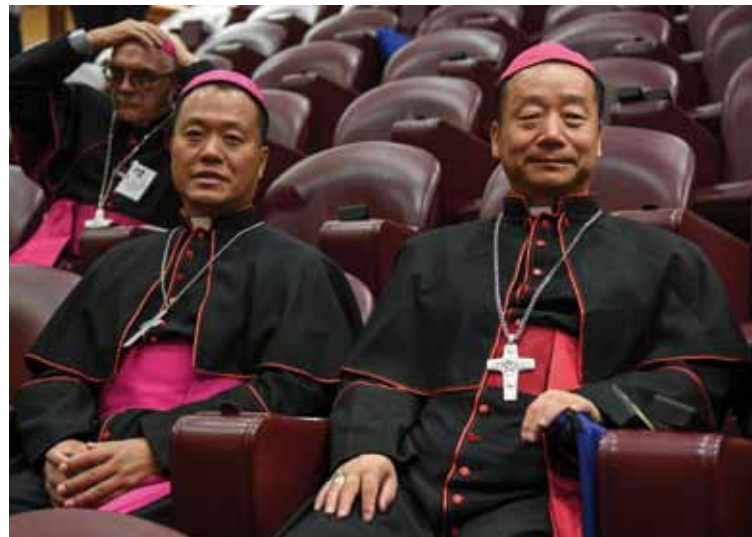
Por primera vez han participado en el Sínodo dos obispos de China Continental.

Francisco resaltó que el discernimiento es el método y al mismo tiempo el objetivo que