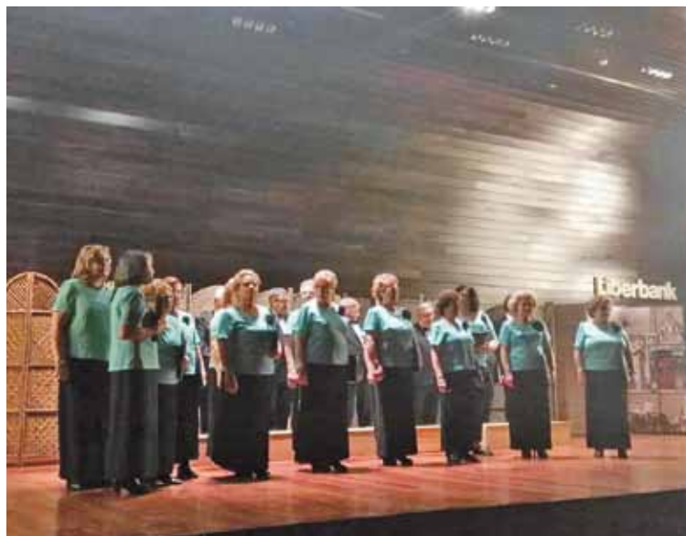
Una actuación de la Coral Sopeña, en Toledo.

En la oferta educativa se impartirá español (con todos los