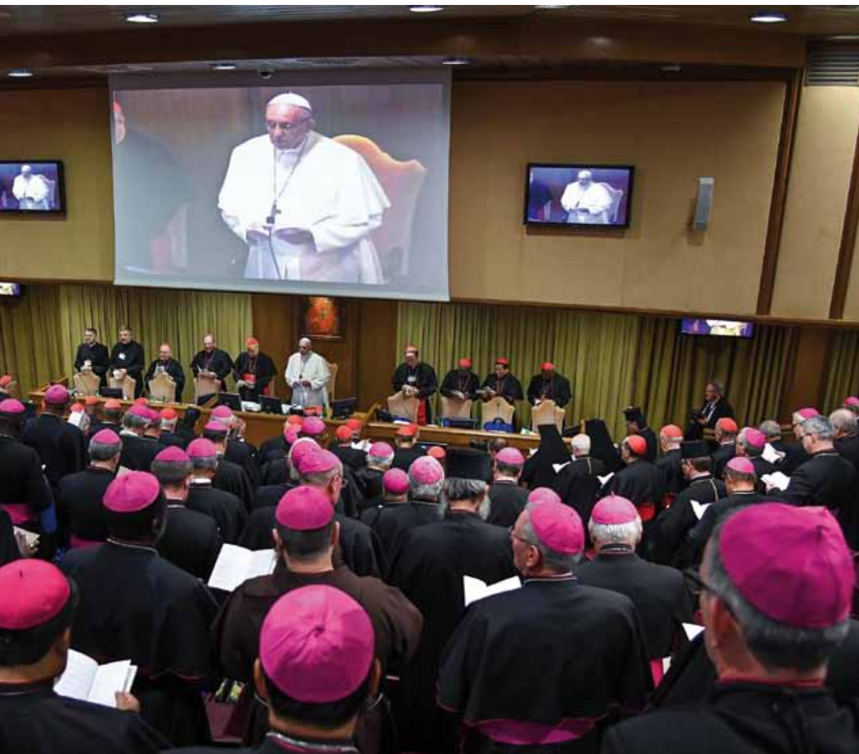
Los participantes en la apertura del Sínodo de los Obispos sobre «los jóvenes, la fe y el discernimiento vocacional».