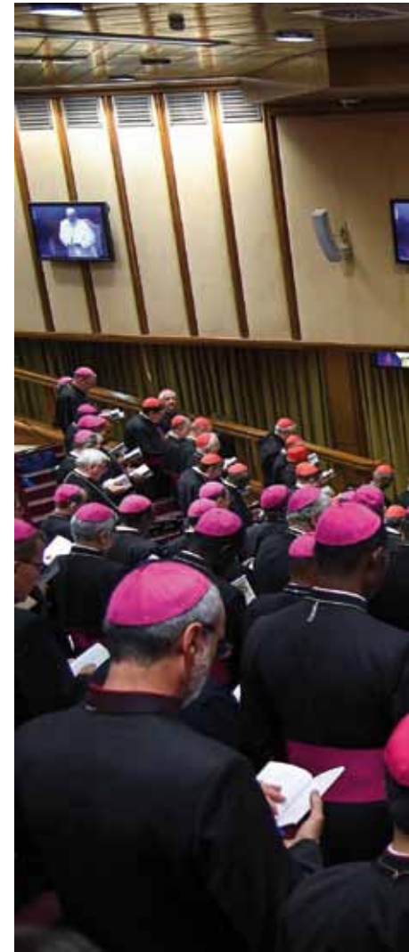
El Papa Francisco se dirige, el pasado 3 de octubre, a

nos fijamos: «se basa en la convicción de que Dios actúa en la historia del mundo, en los acontecimientos de la vida, en las personas que encuentro y que me hablan. Por eso estamos llamados a escuchar lo que el Espíritu nos sugiere, de maneras y en direcciones que a menudo son impredecibles».