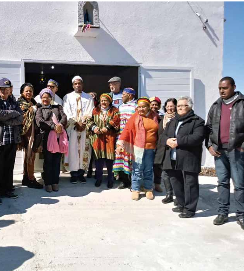
Arrecida, que se ha contruido en Brasil con ayudas de nuestra archidiócesis.