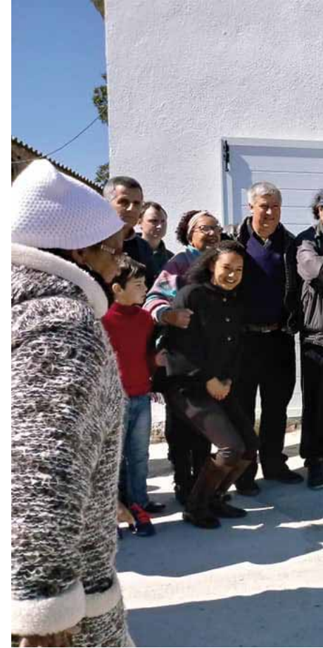
Algunos fieles anta la capilla de Nuestra Señora de Aparecida

existido un leve descenso», del año 2016 al 2017, de 11.448,63 euros. En el año 2017 la Archidiócesis de Toledo contribuyó al DOMUND con la cantidad de 218.515,45 euros, gracias a la aportación de fieles, parroquias y ámbito educativo, siendo necesario hacer un ejercicio de gratitud sincera, «porque cada euro es una aportación al trabajo misionero, que es repartido de manera equitativa y con criterios de solidaridad muy importantes, ya que todo el dinero se pone a disposición del Papa Francisco, ya que esta jornada es pontificia, es decir,