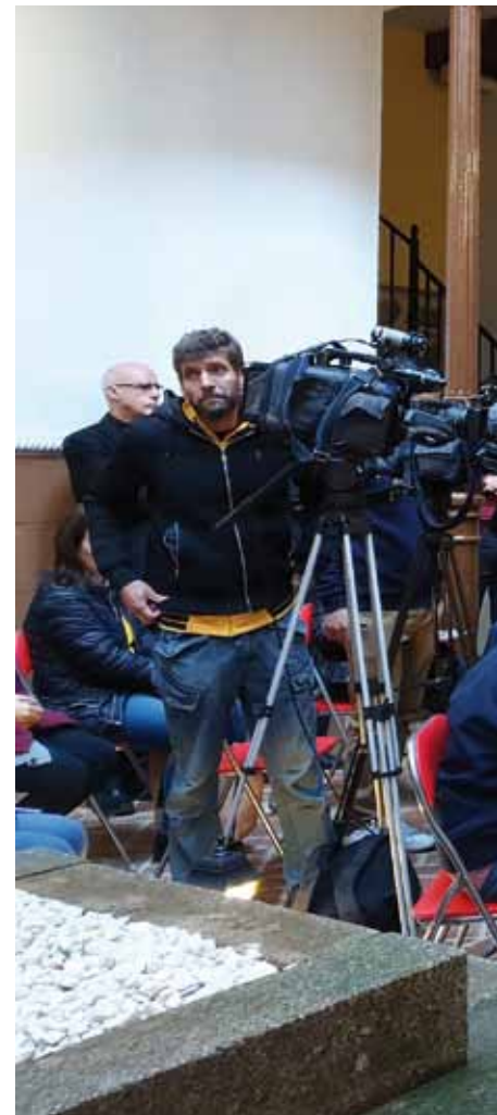
La presentación de las nueve viviendas despertó gran