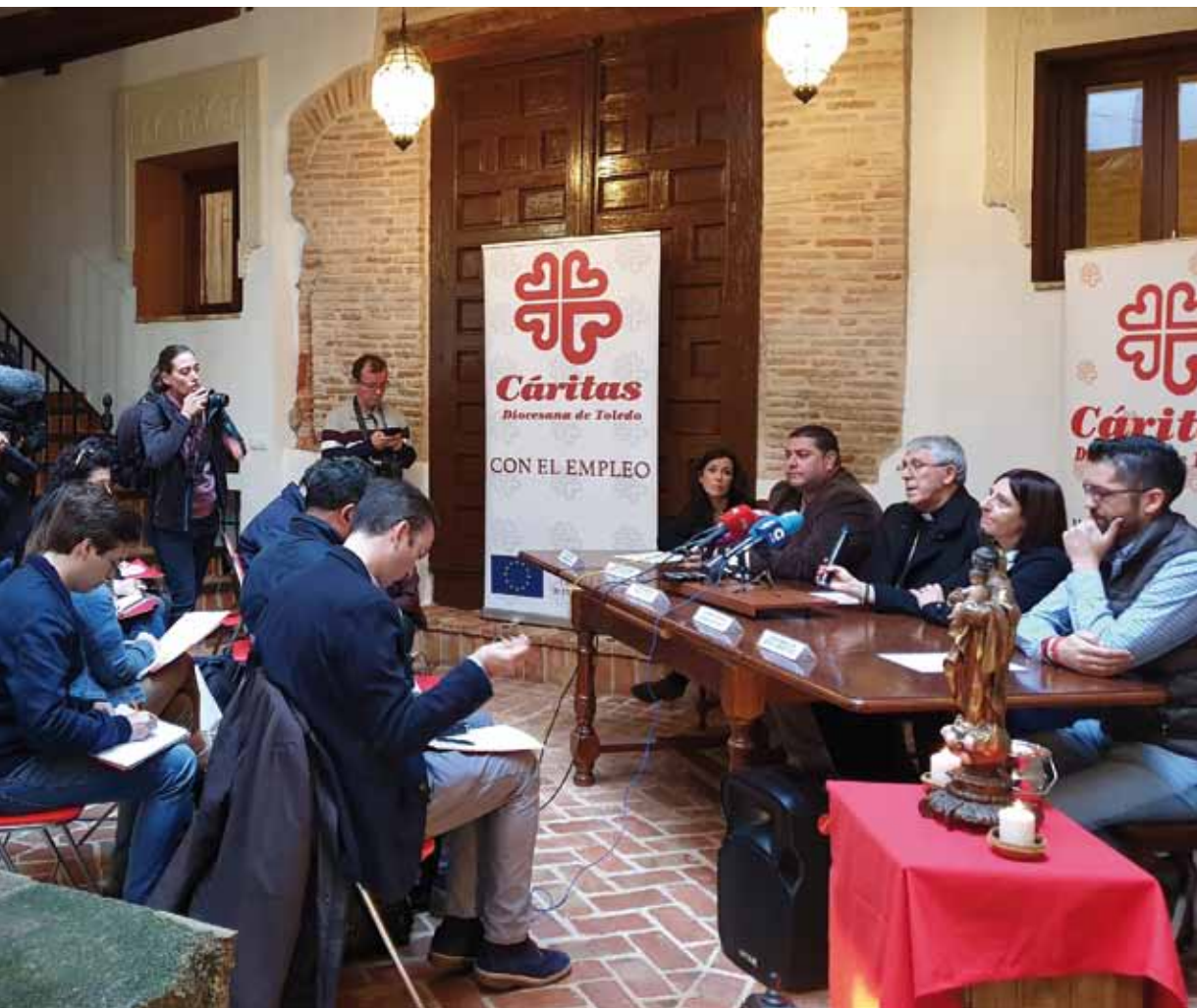
Interés en los medios de comunicación.

habían abandonado y seis de ellos lograron finalizar la Educación Secundario Obligatoria. Los alumnos –añadió la coordinadora del Área de Empleo– aparte de la formación recibida en el Taller hacen cursos de Carretileros y todas aquellas formaciones necesarias para la incorporación a la vida laboral; adaptándose a todas las novedades del mercado laboral actual. Así mismo realizan módulos transversales de alfabetización informática, prevención de riesgos laborales, sensibilización medioambiental e igualdad de oportunidades y se les facilita formación para optar a la tarjeta profesional de la construcción.