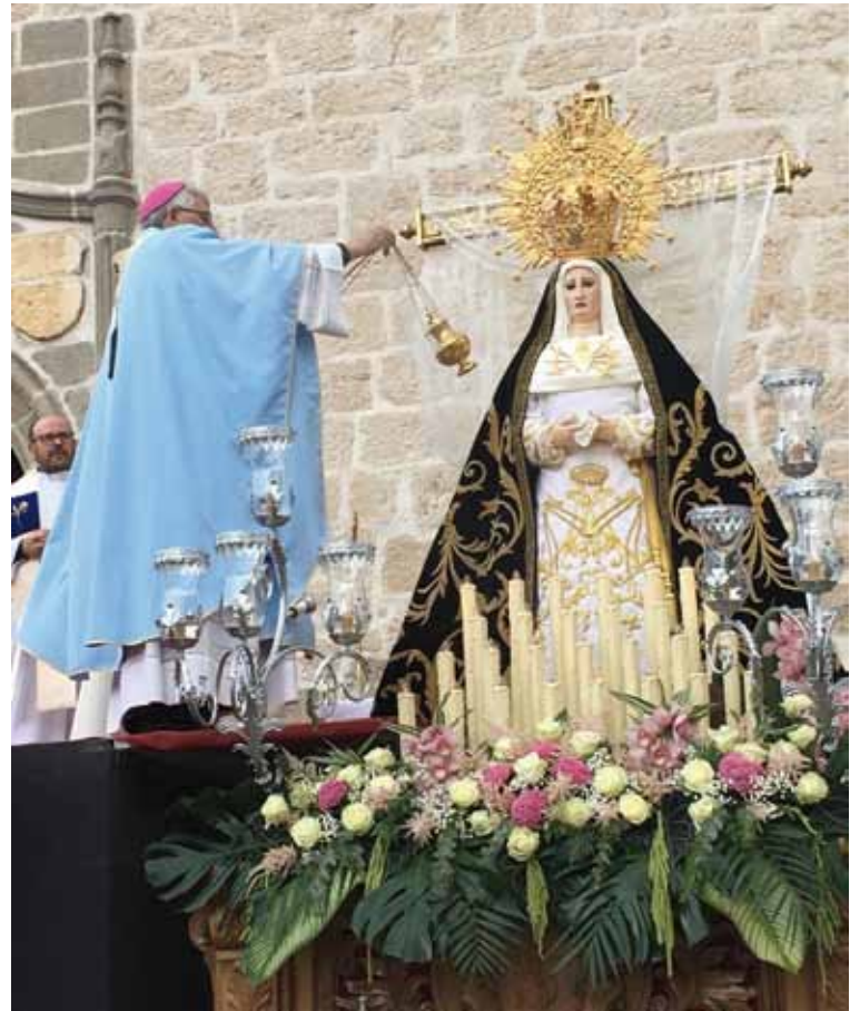
El Sr. Arzobispo incienso la imagen de la Virgen tras su coronación.

El domingo anterior, tras la celebración de la Santa Misa,