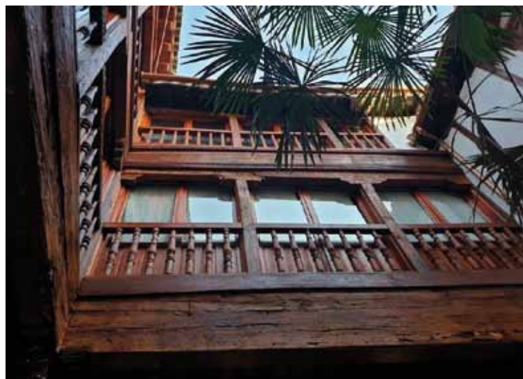
Patio de unas viviendas que han sido restauradas.

Este taller está financiado por el Fondo Social Europeo a través del Programa Operativo de Inclusión y Economía Social así como por una parte correspondiente al IRPF, casilla otros fines de interés social, asignado a nuestra Comunidad Autónoma, junto a recursos propios de Cáritas Diocesana de Toledo. Desde su inicio han pasado 35 alumnos de los cuales, 17 han encontrado empleo durante el taller o después de haberlo finalizado. Además ocho han decidido retomar los estudios que