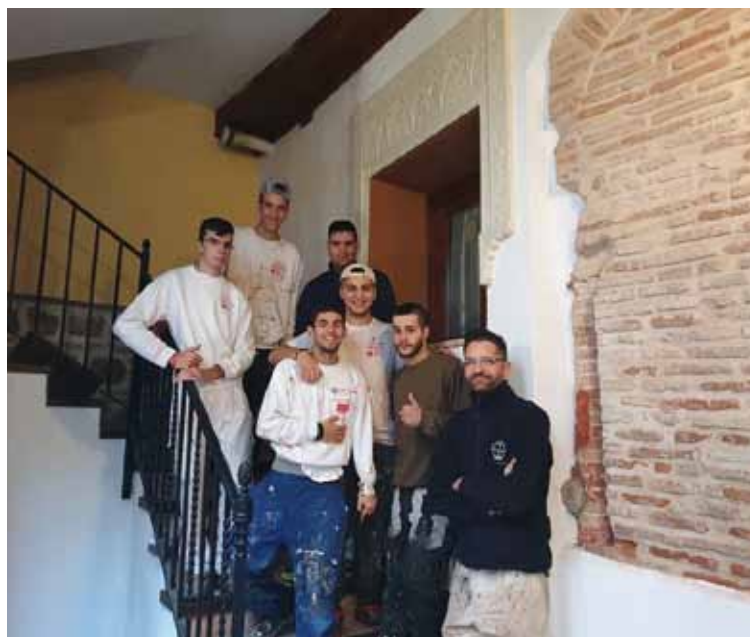
Alumnos del taller de polimantenedor de edificios de Cáritas Diocesana.