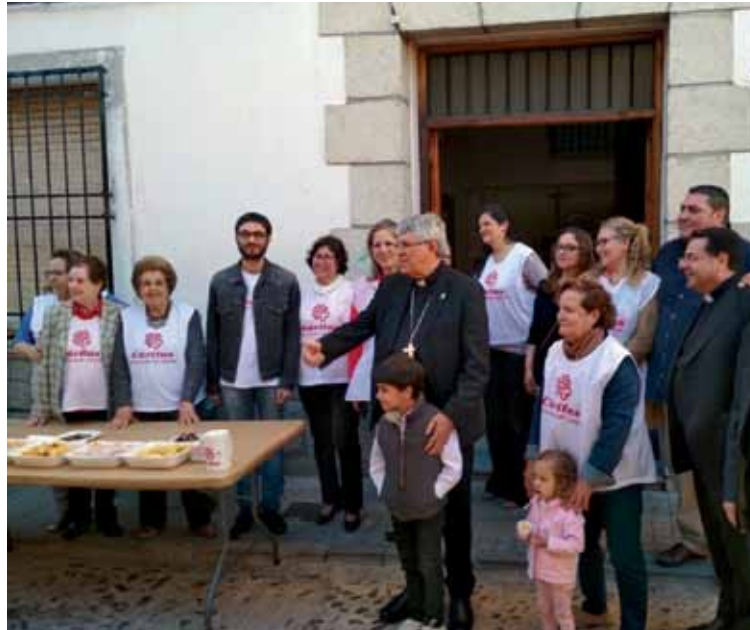
El Sr. Arzobispo, con voluntarios de Cáritas en la parroquia de Torrijos.

«Si miramos con el corazón, más allá de los aspectos externos, descubriremos a una