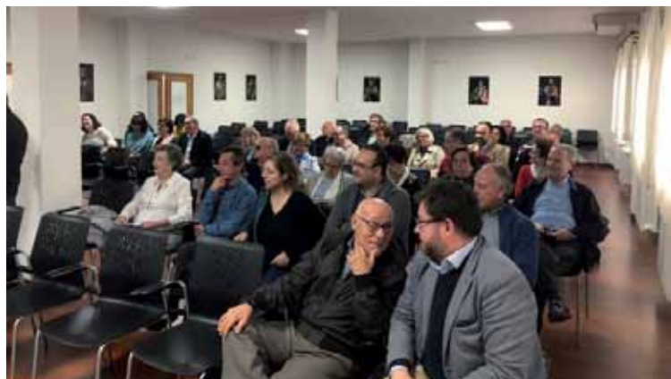
Algunos de los participantes en la Jornada.

La Asamblea es uno de los tres actos específicos que tiene la Acción Católica en su agenda anual para fortalecer y animar el compromiso militante, junto al Retiro-Convivencia del primer domingo de Cuaresma y a la celebración del Día de la Acción Católica, en Pentecostés.