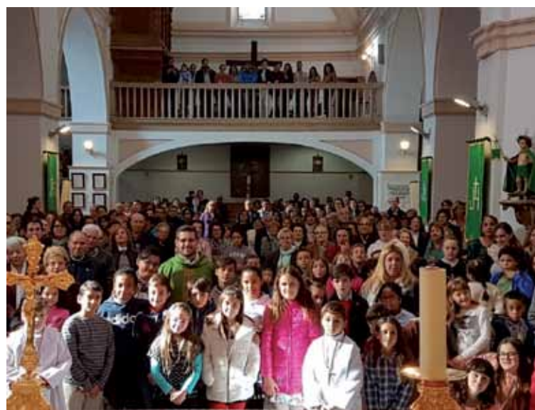
En la parroquia, todos «somos una gran familia, contigo».

El capítulo de ingresos de patrimonio y otras actividades suman una cantidad que supera los once millones y medio, mientras que los ingresos corrientes se acercan a los ocho millones. La cantidad que corresponde a enajenaciones de patrimonio y otros ingresos extraordinarios, supera levemente los siete millones. Toda la información, con las cantidades exactas, quedan detalladas en los gráficos de la página anterior.