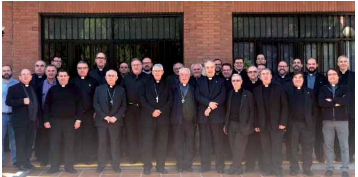
El Colegio Arciprestal, con el Sr. Arzobispo, el obispo electo de Albacete, el emérito de Segovia, el vicario general y los vicarios episcopales.

La inauguración del Año Jubilar, según ha explica el propio párroco, «comenzará el 13 de septiembre de 2019, víspera de la fiesta litúrgica de la Exaltación de la Santa Cruz. El Año Santo se extenderá hasta septiembre de 2020».