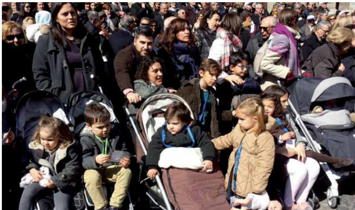
Familias participantes en los actos del 50º aniversario del Movimiento Familiar Cristiano celebrados en Toledo.

lizadora, la actividad educativa, la acción caritativa y social y la actividad cultural. Cada una de estas actividades engloba una gran cantidad de acciones que se desarrollan a través de instituciones diocesanas, parroquias, comunidades de vida religiosa, colegios diocesanos y otras entidades como los medios de comunicación social o las diversas fundaciones educativas o sociales, cada una con sus fines específicos.