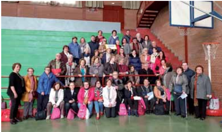
Algunos de los voluntarios de nuestra archidiócesis, con el Sr. Arzobispo-