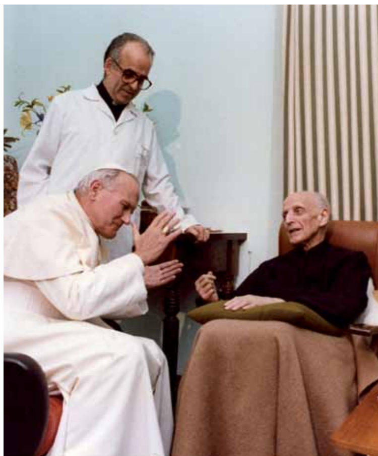
Juan Pablo II visita al P. Arrupe

A continuación, los distintos responsables del proceso diocesano comenzarán a trabajar tomando declaración a más de cien testigos repartidos principalmente en España, Japón e Italia. Con todo, ya estos meses previos han empezado su labor