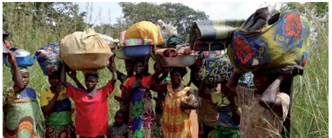
Refugiados que huyen de la violencia en República Centroafricana.

«Tenemos que llegar al fondo de lo que está ocurriendo en República Centroafricana. Grupos como la UPC están formados por mercenarios extranjeros que han estado ocupando nuestro territorio desde hace 5