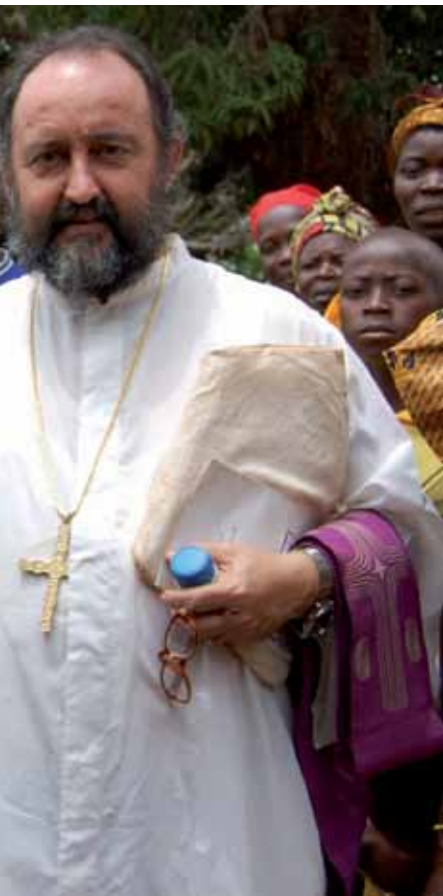
e su diócesis.

años. Están pagados por algunos países del Golfo y dirigidos por algunos países africanos vecinos. Entran por el Chad a través de Birao, con armas vendidas a Arabia Saudita por los Estados Unidos. Quieren dividir República Centroafricana alimentando el odio entre musulmanes y no musulmanes. De esta manera pueden aprovechar y saquear las riquezas del país, como el oro, los diamantes y el ganado. Pero sobre todo algunos países extranjeros y no africanos quieren utilizar República Centroafricana como puerta de entrada a la República Democrática del Congo y al resto del continente, manipulando el Islam radical. Este es el juego detrás de la masacre de Alindao», concluye el misionero.