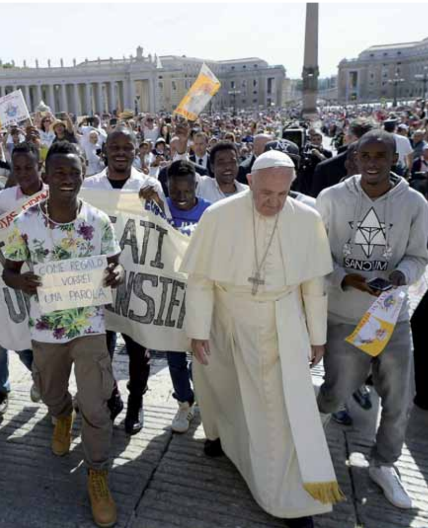
inmigrantes en la plaza de San Pedro.

visión reduccionista de la persona humana abre el camino a la propagación de la injusticia, de la desigualdad social y de la corrupción». Y así nos ha advertido de nuevas amenazas para los derechos humanos, derivadas de interpretaciones progresivamente cambiantes, incluyendo una multiplicidad de «nuevos derechos», no pocas veces en contraposición entre ellos y que en algunos casos suponen incluso formas de «colonización ideológica» de los más fuertes y los más ricos en detrimento de los más pobres y los más débiles.