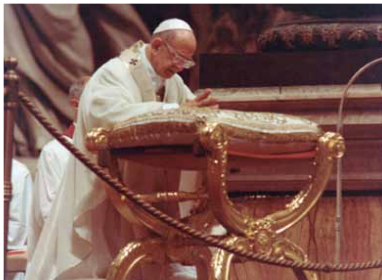
El Papa san Pablo VI, en oración en la basílica vaticana.

a la integridad corporal y a un decoroso nivel de vida (alimento, vestido, vivienda, descanso, asistencia médica, así como seguros de invalidez, viudedad, vejez y paro); derecho a la buena fama, a la posibilidad de buscar la verdad libremente y a los bienes de la cultura, a la libre expresión y a una información objetiva; derecho al culto divino y a profesar la religión en privado y en público; derecho a elegir el estado de vida, fundar una familia con iguales derechos y deberes entre el varón y la mujer, o a seguir la vocación a la vida religiosa o sacerdotal;