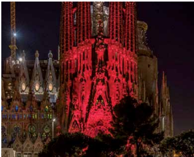
La Sagrada Familia se iluminó de rojo para reivindicar el derecho a la libertad religiosa.

Estos países con estados autoritarios y con nacionalismos extremos son en total 16,