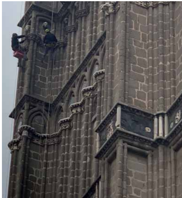
Los técnicos inspeccionaron el estado de la torre el pasado mes de octubre.

El informe resultante de la inspección arroja datos sobre