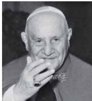
San Juan XXIII.

Antes, san Juan XXIII, en Pacem in Terris , presentaba la siguiente relación de derechos humanos, a cuyo cumplimiento urgía: Derecho a la existencia