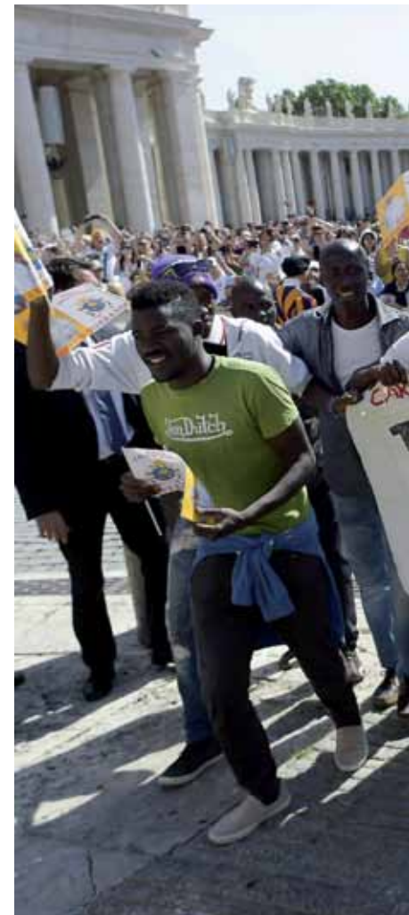
El Papa Francisco camina junto a un grupo de jóvenes

derecho de los padres, antes que nadie, a mantener y a educar a los hijos; derecho a que se facilite la posibilidad de trabajar, en unas condiciones dignas (con un salario justo y familiar) y a la libre iniciativa económica; derecho a la propiedad privada, considerando su función social; derecho de reunión y asociación; derecho de residencia y emigración, en tanto que ciudadanos de una comunidad política, pero también miembros de la familia humana y sociedad universal; derecho a intervenir en la vida pública; derecho a la seguridad jurídica y defensa legítima de los propios derechos.