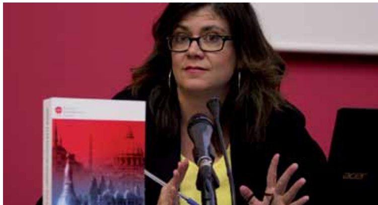
Acto de presentación del Informe sobre la libertad religiosa 2018.