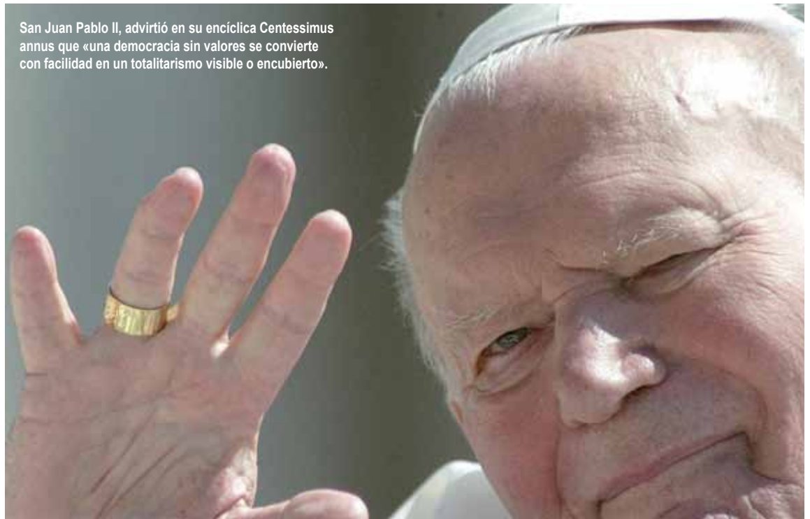
San Juan Pablo II, advirtió en su encíclica Centessimus annus que «una democracia sin valores se convierte con facilidad en un totalitarismo visible o encubierto».

cristiana y una lectura creyente de los acontecimientos.