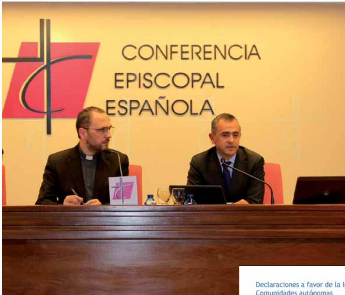
El vicesecretario para asuntos económicos de la CEE, durante la presentación de los datos.