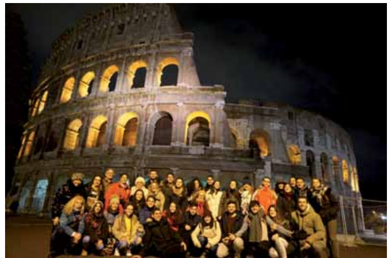
Los jóvenes, en Santa María la Mayor y en el Coliseo.

taran de cada momento. El arte estuvo presente en todas sus vertientes este día, pues pudieron adentrarse en los Museos Vaticanos y en la admirable Capilla Sixtina. También visitaron la basílica de San Pablo Extramuros y una de las plazas más conocidas de Roma, la Piazza Navona.