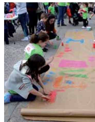
Arriba, la salida de la Marcha por la Vida. En las fotos inferiores, algunos de los asistentes al Festival, en el pabellón polideportivo, y unas niñas realizando un mural «por la vida».

Posteriormente, a las cuatro de la tarde, dieron comienzo los actos deportivos, coordinados por Evedeport, con las carreras infantiles; una hora más tarde se dio salida a la carrera absoluta, de 5 km., y poco después comenzó la marcha «Por la Mujer y la Vida», en la que se reivindicó que «La Vida Vence», que recorrió la Avenida de Europa de Toledo.