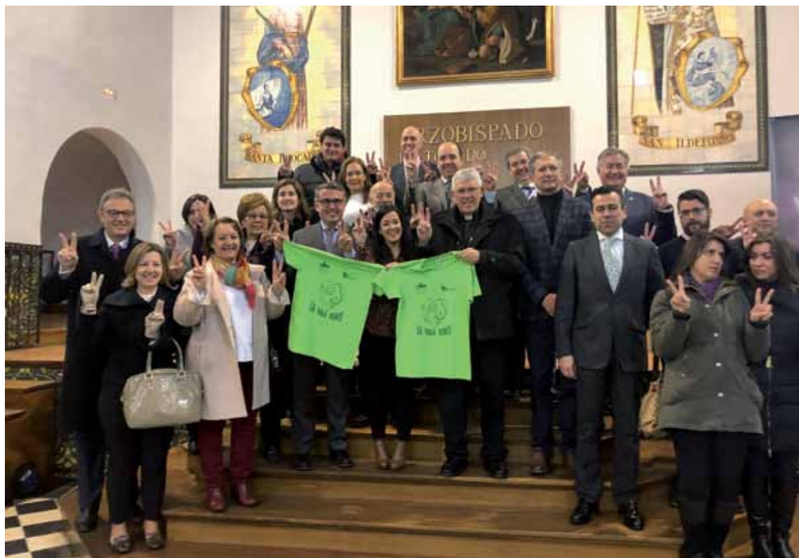
El Sr. Arzobispo, junto con algunos de los organizadores y representantes de las entidades patrocinadoras durante la presentación.

Además, agradeció a las empresas, organismos, entidades y personas particulares que han colaborado en la IV Fiesta por la Mujer y la Vida, «que redundará en un hacer mejor esta sociedad».