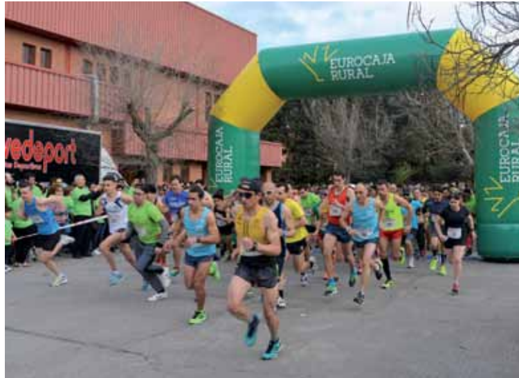
Salida de la carrera absoluta, de cinco kilómetros.

En el Manifiesto que fue PADRE NUESTRO / 3 DE MARZO DE 2019