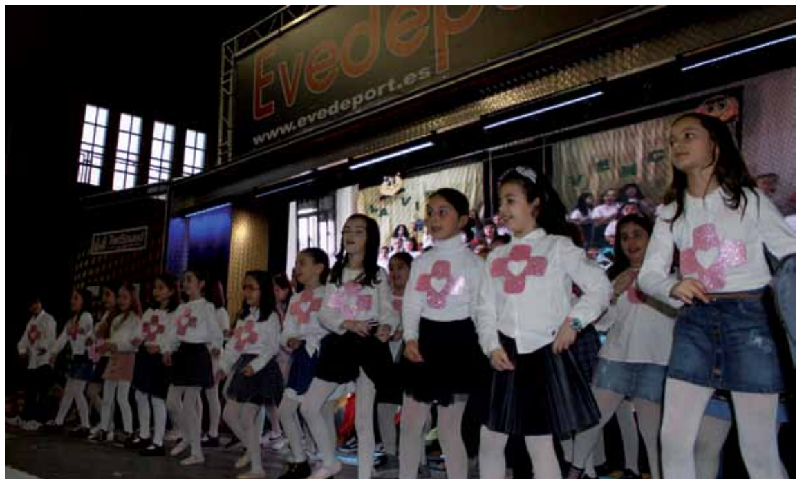
Las niñas del Colegio Cristo de la Sangre, de Torrijos, ganaron el concurso «Canta por la Vida».

La IV Fiesta por la Mujer y la Vida dio comienzo a las 12 de la mañana con la Gymkhana Interactiva «El mayor patrimonio: la Vida», en la que 60 jóvenes recorrieron los siete monumentos de la Pulsera Turística de Toledo, permitiéndoles conocer los principales monumentos turísticos de la ciudad.