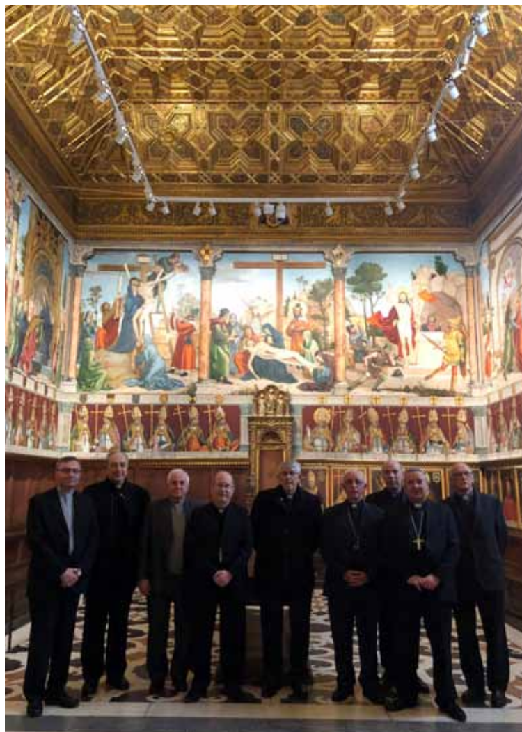
Los Obispos y sus vicarios generales durante su visita a la Sala Capitular.

Después de la comida, a primera hora la tarde, los obispos y