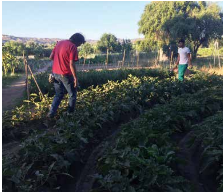
Taller de agricultura de Cáritas Diocesana.

Cáritas Diocesana reivindica que el trabajo es esencial en la vida de las personas porque ayuda a construir humanidad. A través de él se potencia, se desarrolla y se expanden nuestras capacidades y cualidades, y por ello hay que recordar, tal y como decía Juan Pablo II en el número 6 de su encíclica Laborem Exercens , que «el trabajo está en función de la persona y no la persona en función del trabajo».