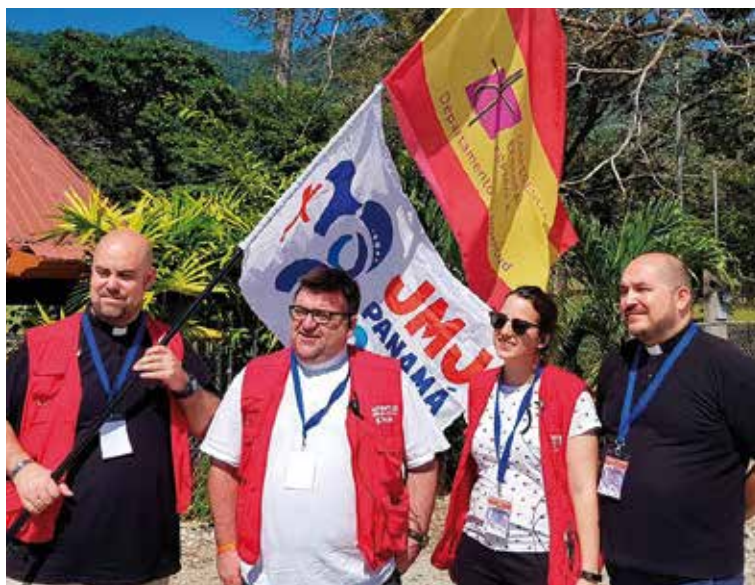
En la foto superior, con algunos de los participantes españoles en el Sínodo de los Jóvenes. Abajo, los toledanos participantes en la Jornada Mundial de la Juventud, en Panamá.

planeta». Para esto, precisa, «es fundamental que sea cercana a las causas nobles, que se ocupe de los más pobres, denunciando lo que destruye la vida de las personas, margina, excluye, o sea motivo de iniquidad».