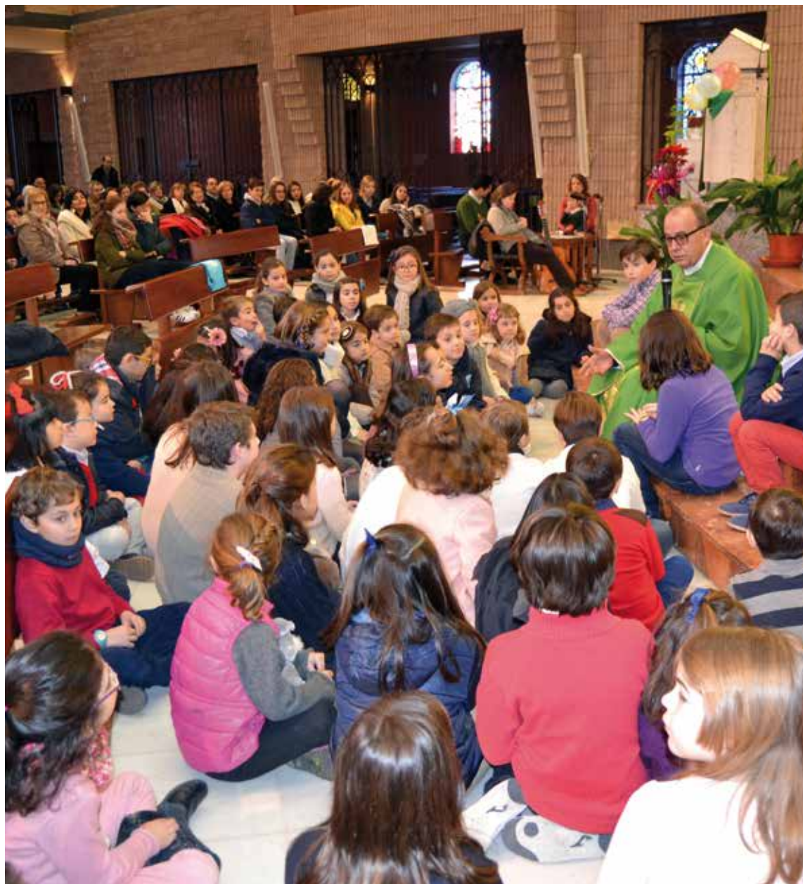
El Delegado Diocesano de Misiones, con los niños participantes en una Jornada de la Infancia Misionera, en Toledo.