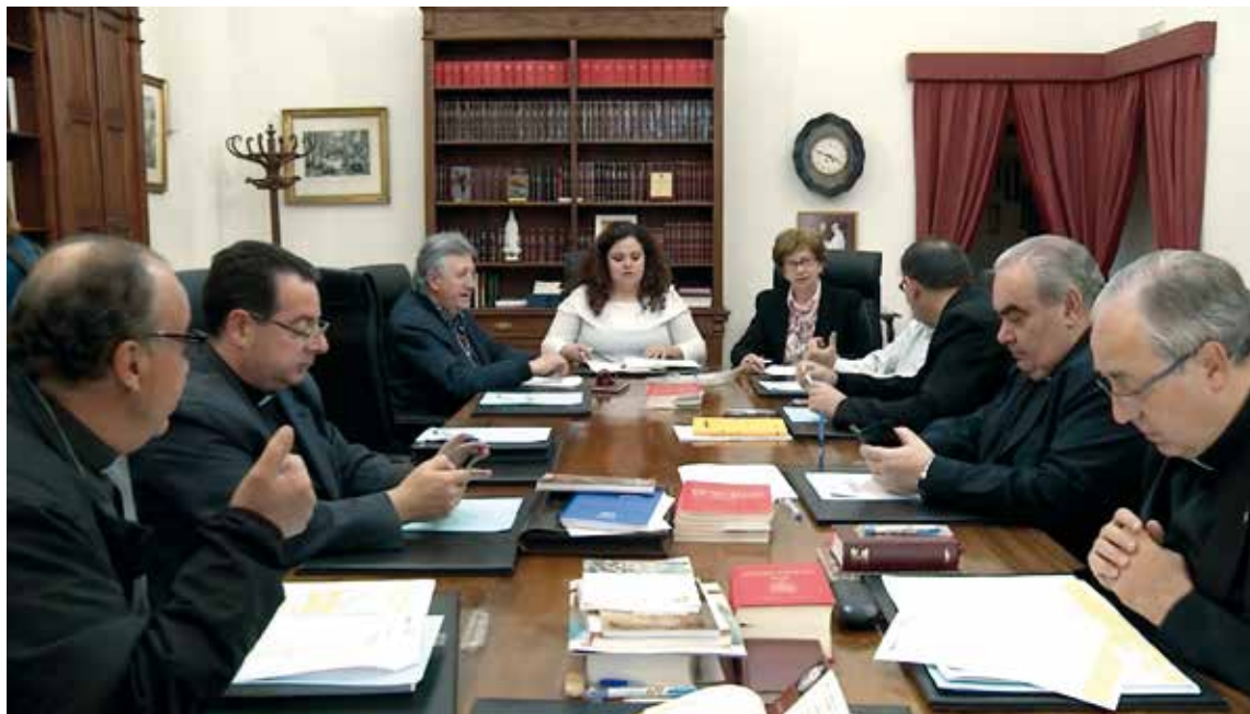
Algunos de los miembros de la Comisión para el Mes Misionero Extraordinario constituida el pasado 2 de mayo.

Nuestra Archidiócesis pone en marcha la programación diocesana que contará con la implicación de todas las realidades diocesanas y comenzará con una Vigilia Misionera, el 1 de octubre, en Talavera de la Reina