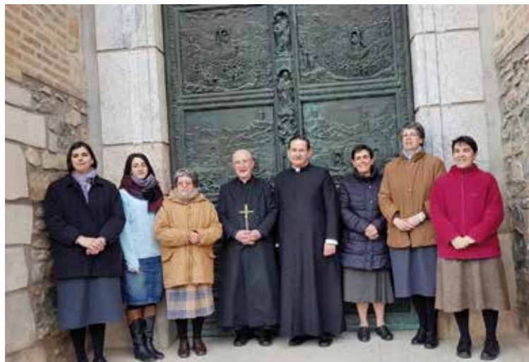
Las misioneras, con el cura párroco y el director de la Misión.