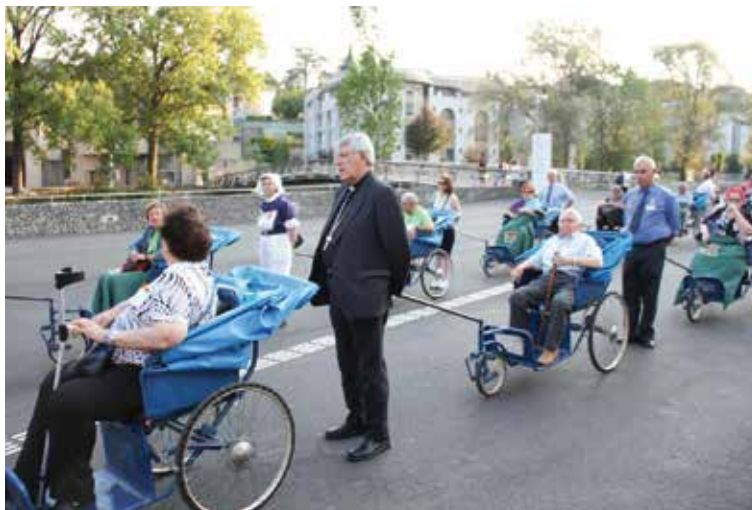
El Sr. Arzobispo, en la peregrinación del año 2016.

Con el lema «Bienaventurados los pobres», el santuario celebra el «Año Bernardette», que conmemora el 175 aniversario del nacimiento de la santa y los 140 de su muerte. En esta conmemoración la Hospitalidad de Nuestra Señora de Lourdes de Toledo prepara la que será la