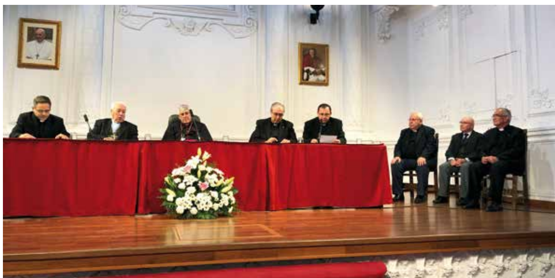
Arriba, los sacerdotes que celebran Bodas de Oro y Plata, con el Sr. Arzobispo. Debajo, un momento de la conferencia en el salón de actos.

más allá de nuestras propias dotes, algo que nosotros mismos no podemos hacer».