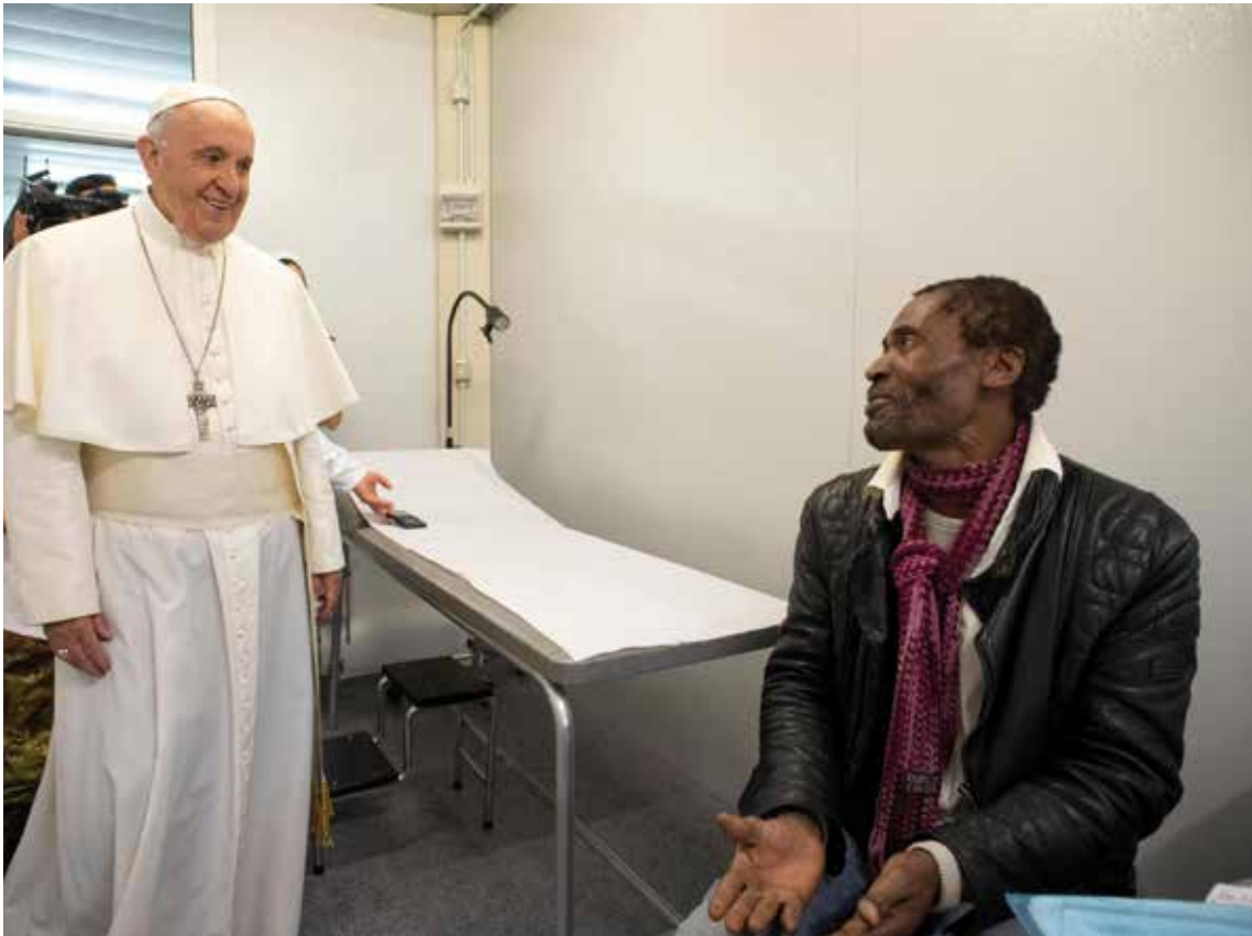
El Papa conversa con un hombre en el ambulatorio abierto en El Vaticano para personas sin recursos.

discípulos, la tarea de llevarlo adelante, con la responsabilidad de dar esperanza a los pobres. Es necesario, especialmente en un período como el nuestro, revivir la esperanza y restaurar la confianza. Es un programa que la comunidad cristiana no puede subestimar. La credibilidad de nuestra proclamación y el testimonio de los cristianos depende de ello.