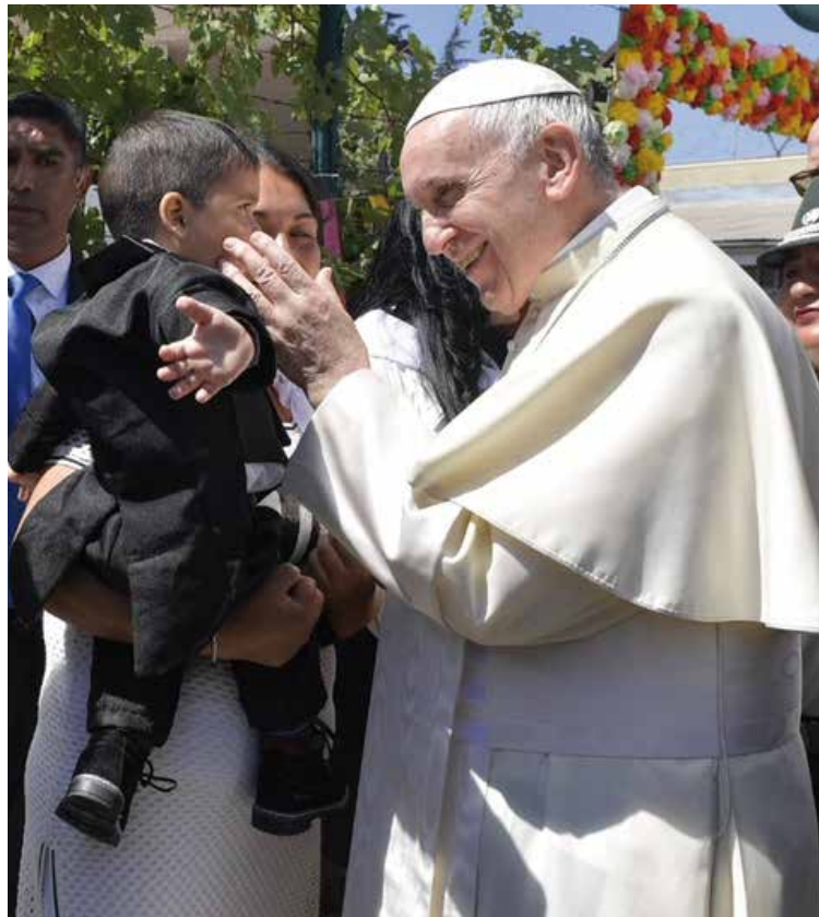
Visita a una cárcel de mujeres en Chile.

El tema del Mensaje es, por lo tanto, el Salmo cuyas palabras, explica el Papa, manifiestan ante todo una «actualidad increíble». Hoy, como en el momento de la composición del Salmo, un «gran desarrollo económico» ha generado una desigualdad como para enriquecer a grupos de personas a costa de una masa cada vez más pobre: personas indigentes que «carecen de lo necesario» y «privilegiadas» que, «sin ningún sentido de Dios», dan la caza a los pobres para «tomar incluso lo poco que tienen» y esclavizarlos. Aquí están los «nuevos esclavos» que Francesco designa: familias obligadas a emigrar a vivir, huérfanos explotados, jóvenes desempleados por «políticas miopes», inmigrantes «víctimas de intereses»