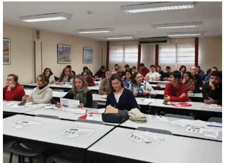
Asistentes a la primera jornada de formación.

La Jornada se inaugurará a las 9:30 h. y posteriormente tendrá lugar la primera ponencia sobre «¿Qué es el amor zero? Cómo reconocer una relación destructiva. Las 20 señales de alerta». La segunda ponencia versará sobre «El alma violada. Decepción, abuso y maltrato psicológico» y, por la tarde, a