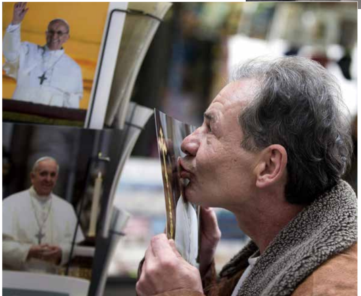
Un indigente besa una imagen del Papa Francisco tras ser atendido en un centro de acogida de la Santa Sede, en Roma.