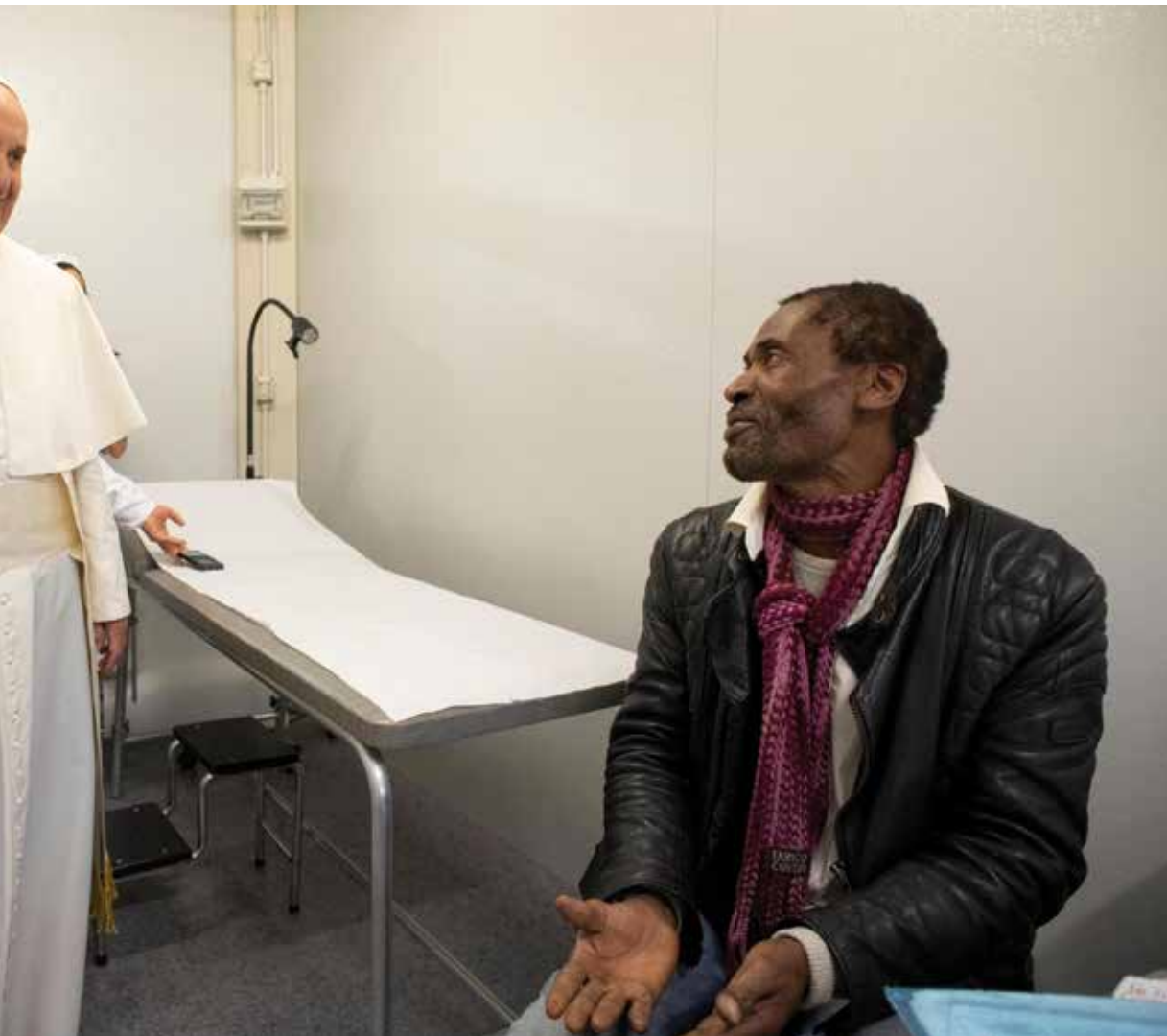
El Papa Francisco visita a un hombre atendido en un centro de atención sanitaria a los pobres de Roma abierto por la Santa Sede.

dar esperanza a los pobres. Es necesario, especialmente en un período como el nuestro, revivir la esperanza y restaurar la confianza. Es un programa que la comunidad cristiana no puede subestimar. La credibilidad de nuestra proclamación y el testimonio de los cristianos depende de ello.