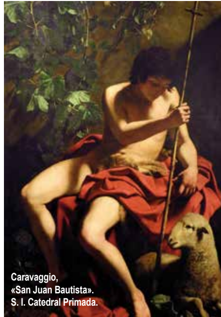
Caravaggio, «San Juan Bautista». S. I. Catedral Primada.

tiempo de gracia recibimos y para que sea eficaz en nosotros, hemos de vencer nuestras rutinas, salir de nuestras monotonías y romper con nuestros convencionalismos. Hemos de convencernos de que la promesa que hoy recibimos no es, como algunos pueden decir, un conjunto de palabras bonitas destinadas a proyectar expectativas ilusorias en hombres ignorantes y crédulos, siempre dispuestos a dejarse fascinar por utopías irrealizables, por quimeras que no son propias del hombre moderno e informado.