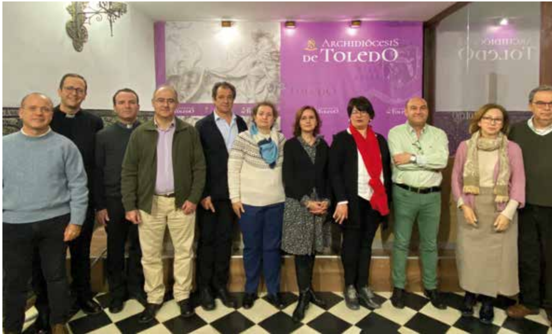
PLATAFORMA REGIONAL «LIBRES PARA EDUCAR A NUESTROS HIJOS»