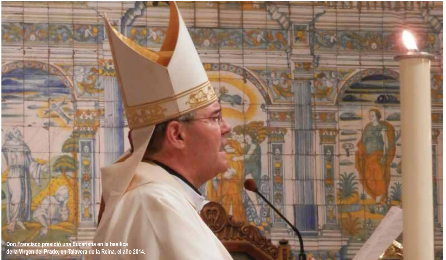
Don Francisco presidió una Eucaristía en la basílica de la Virgen del Prado, en Talavera de la Reina, el año 2014.