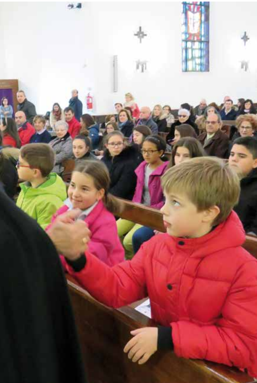
Jornada de la Infancia Misionera, el pasado año, en la parroquia de Santa Bárbara de Toledo.

impulsadas desde la dirección diocesana de OMP, como las habituales visitas de misioneros a los centros educativos o el festival de la Canción Misionera, ayudan a los niños para descubrir la realidad misionera, haciendo que prioricen siempre la opción misionera en su vida.