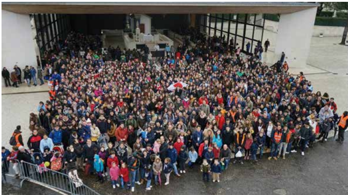
Los participantes en la peregrinación a Fátima el pasado año. #

Durante cuatro días se visitan los lugares de las apariciones, se celebra misa en la Capelinha y tienen lugar numerosas confesiones y también conversiones delante de la Señora. La salida tendrá lugar el viernes 21 por la tarde con noche en Valencia de Alcántara. En la ciudad extremeña se celebrará una primera convivencia entre todos los grupos asistentes a la peregrinación. Al día siguiente,