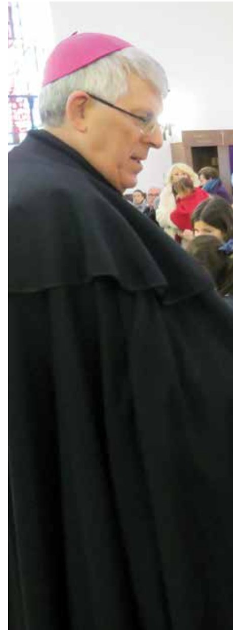
El Sr. Arzobispo saluda a los niños participantes en la

Queda claro, gracias a la Infancia Misionera, que los misioneros siempre están con los niños y ayudan a que pase lo que