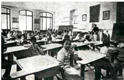
Aula para alumnos gratuitos de los Escolapios, en 1915.