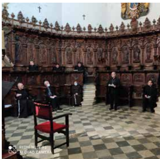
Arriba, reunión de la Vicaría de La Mancha. Debajo, en Talavera de la Reina y en Guadalupe.