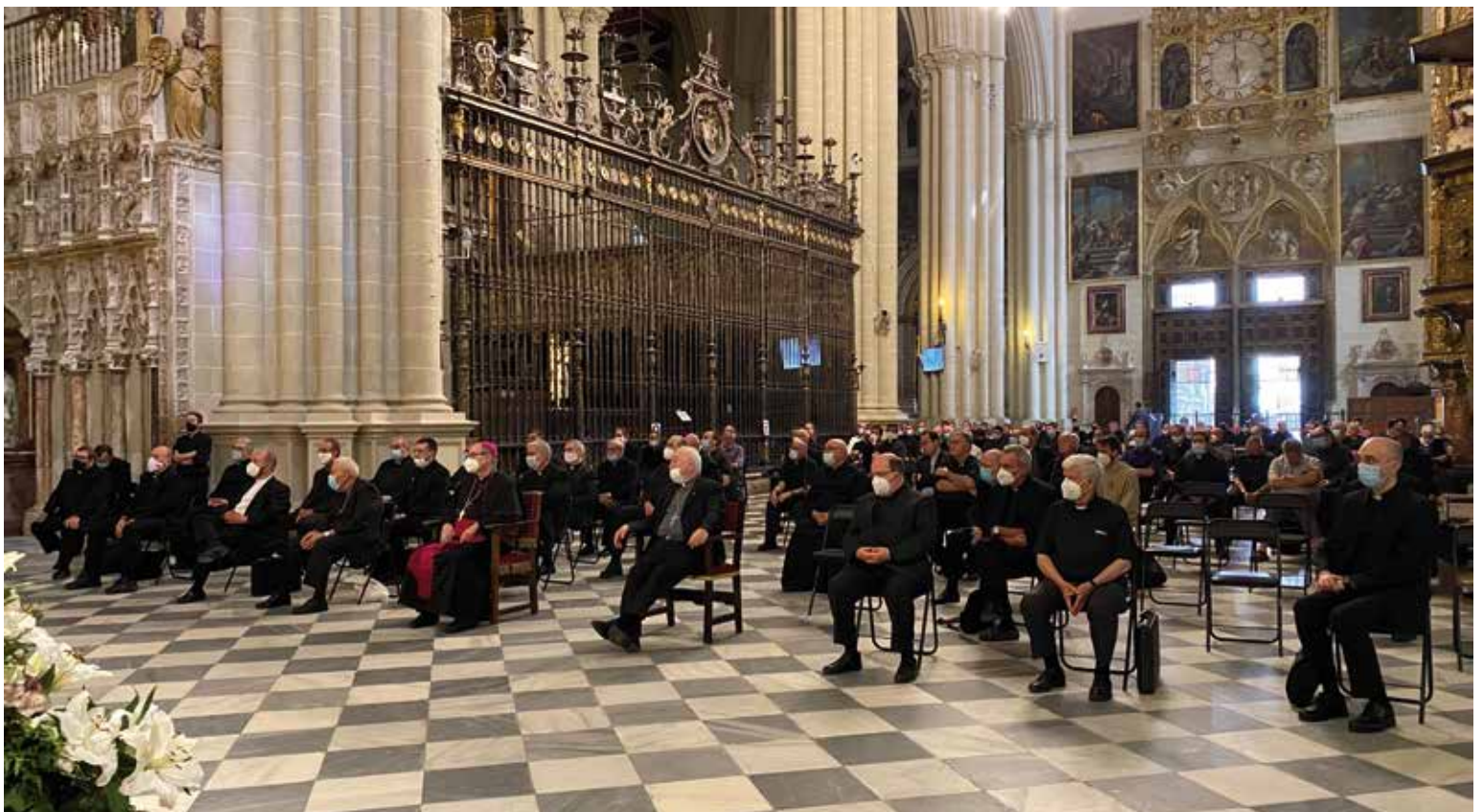
El encuentro sacerdotal se celebró en el crucero de la catedral primada para respetar las medidas de seguridad.

En la mañana del 2 de julio el Sr. Arzobispo presidió una eucaristía en la catedral primada, en la que participaron numerosos sacerdotes de la archidiócesis para celebrar los jubileos sacerdotales de algunos de ellos. En la homilía les invitó a vivir su sacerdocio «enamorado de Jesucristo, profundizando en la vida fraternal y, sobre todo, viviendo algo que es esencial para todos y que es el celo apostólico» (PAGINAS. 6-7)