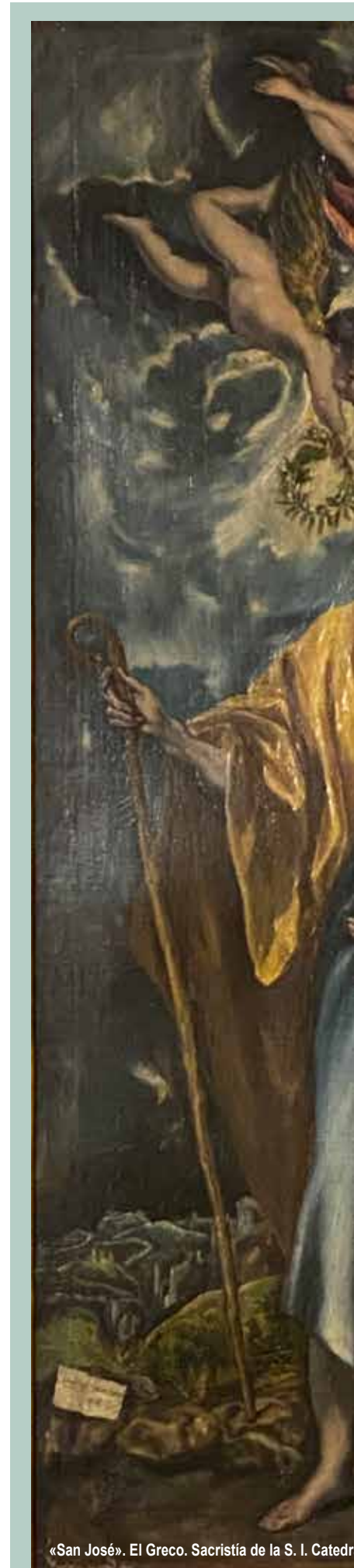
«San José». El Greco. Sacristía de la S. I. Catedral

También incluye «como santuarios peculiarmente bendecidos otros lugares de significatividad especial: los conventos de madres carmelitas de Talavera, Toledo, Yepes y Consuegra; además de la residencia de ancianos de las Hermanitas de los Pobres en Talavera y el Colegio San José de Fuensalida».