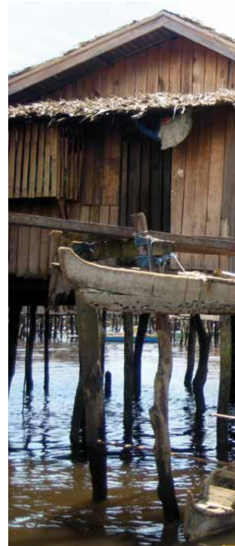
Niños en una cabaña en un poblado en Filipinas.

Proyecto 9. Financian este proyecto los arciprestazgos Madridejos-Consuegra y Méntrida. Educación de mujeres y jóvenes en Lakhanpur y Udai-pur, en India. El objetivo es