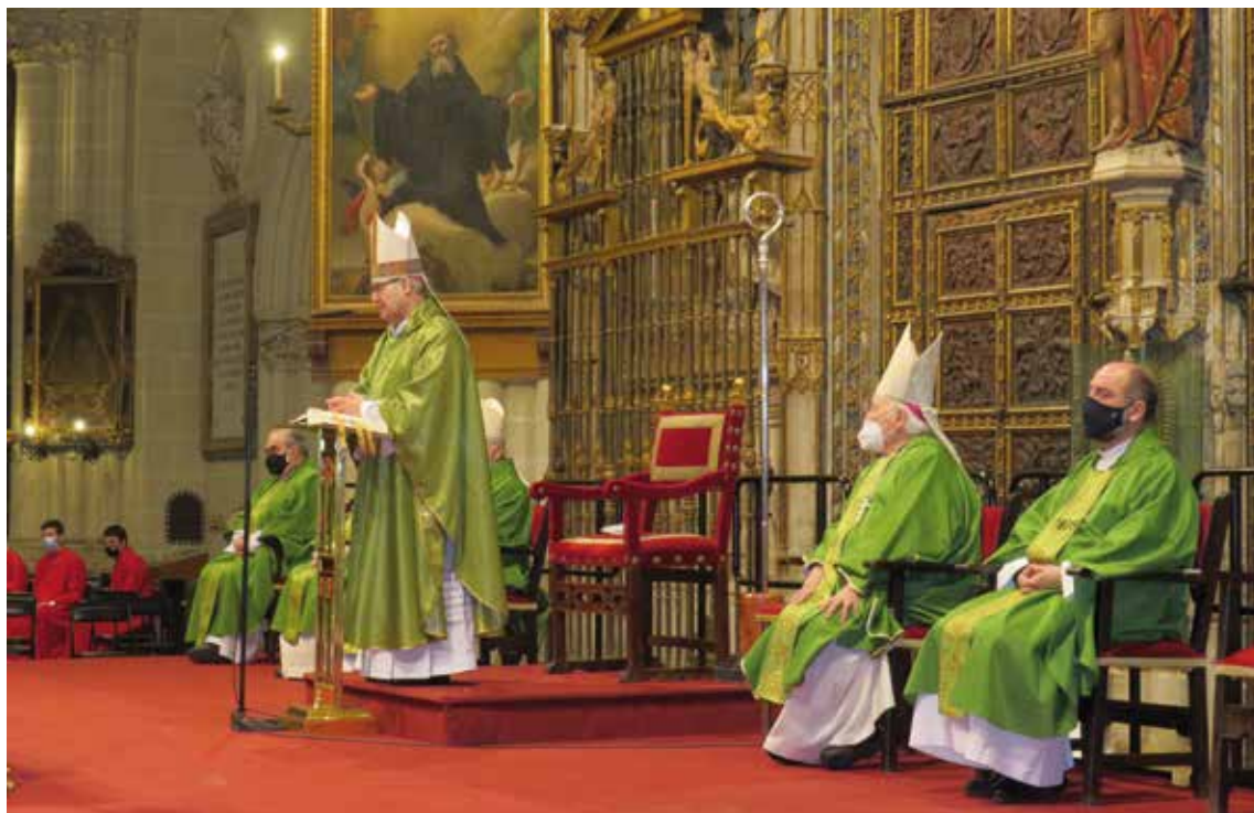
El Sr. Arzobispo pronuncia la homilía en la santa misa de la Jornada de la Infancia Misionera.

bras de memoria agradecida de Sejo, destacando que «era un hombre querido por todos y en su persona hacemos una acción de gracias por todos los misioneros, hombres y mujeres, que