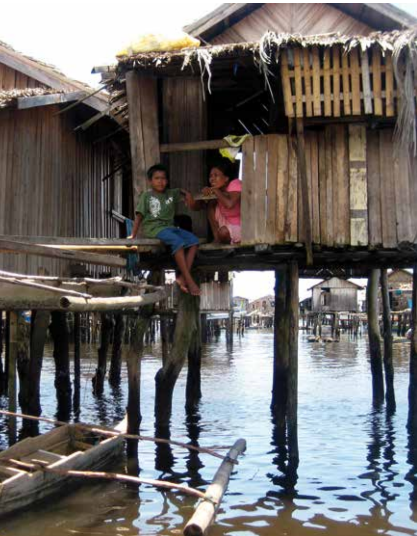
RICARDO OLMEDO / MANOS UNIDAS

centros (uno en cada aldea) de educación no formal, el empoderamiento de las jóvenes con la realización de 2 cursos de costura anuales con 200 beneficiarias en total. Importe total: 40.590 euros.