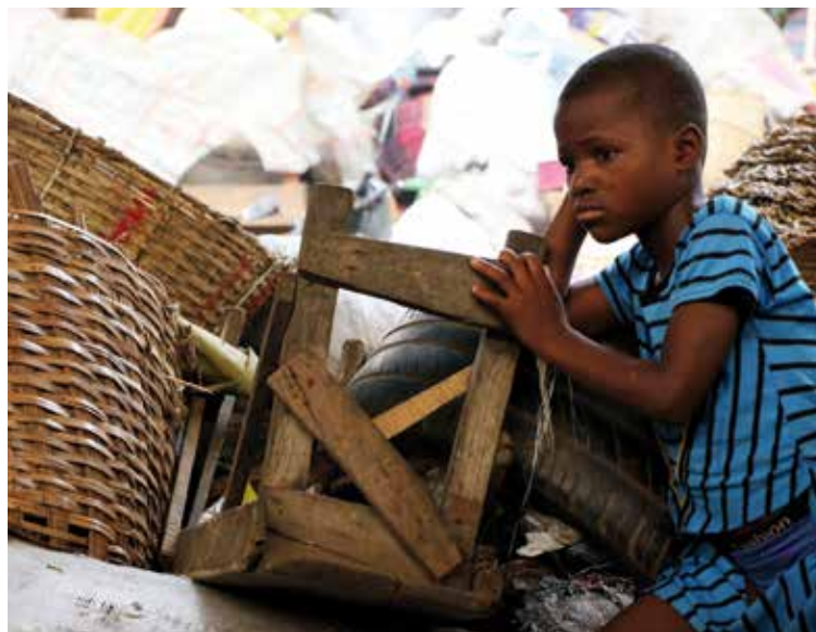
Un niño recoge desechos en Benín.

Proyecto 6. Financiado por los arciprestazgos de Navahermosa, Los Navalmorales y Toledo. Mejora de la seguridad alimentaria, en Nicaragua. Se pretende fortalecer las capacidades de la población de 30 comunidades para implementar prácticas agroecológicas mediante la capacitación, el acceso de las mujeres a tierra productiva. Importe total: 71.996 euros.