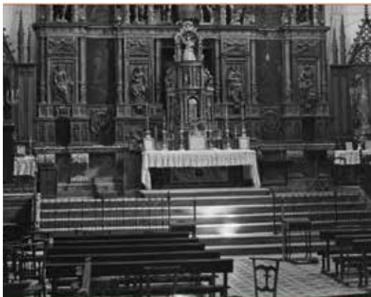
Altar mayor de la iglesia de Sonseca.