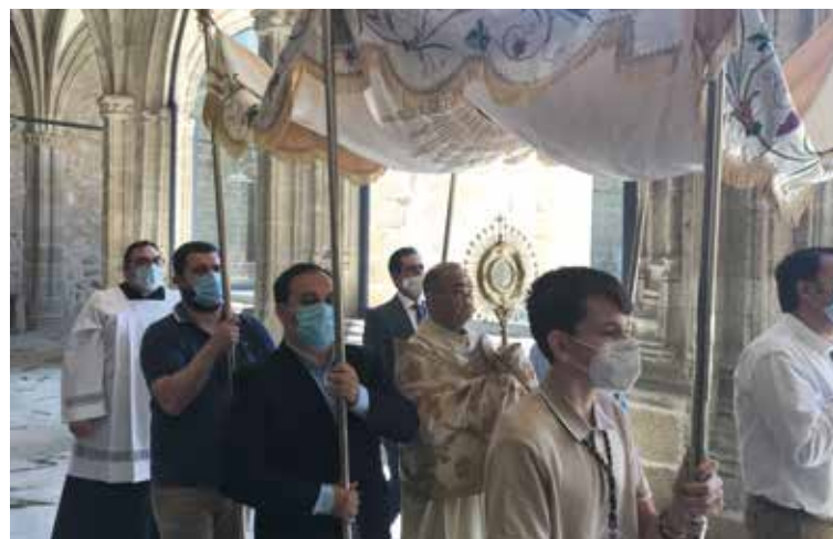
Celebración del Corpus Christi en Talavera, el año pasado.