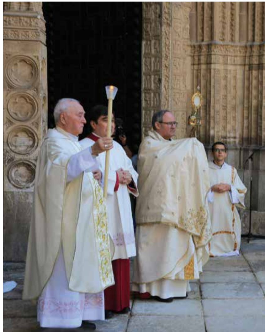
El pasado año el Sr. Arzobispo salió al atrio de la catedral para impartir la bendición con el Santísimo a

En su escrito, el Sr. Arzobispo invita «a las parroquias, a los demás templos, a las comunidades de vida consagrada a que, a pesar de las restricciones, expresemos públicamente de forma sencilla nuestra fe eucarística. Por ello, siempre de acuerdo con las autoridades locales y con lo establecido en la