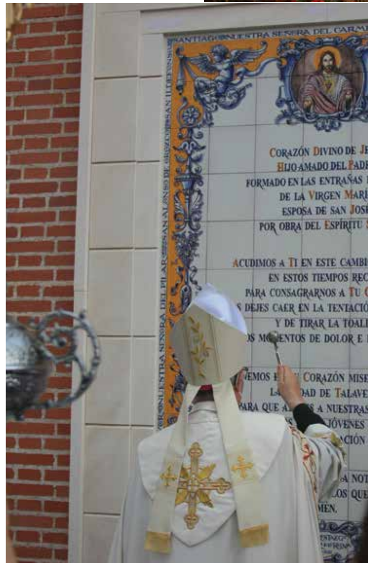
Bendición de la cerámica con la oración de consagración. A la derecha, el monumento al Sagrado Corazón