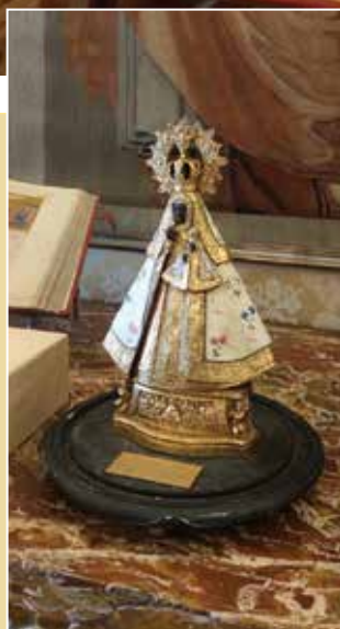
La imagen de la Virgen de Guadalupe fue entregada al Papa Francisco durante la audiencia privada del pasado 10 de mayo.