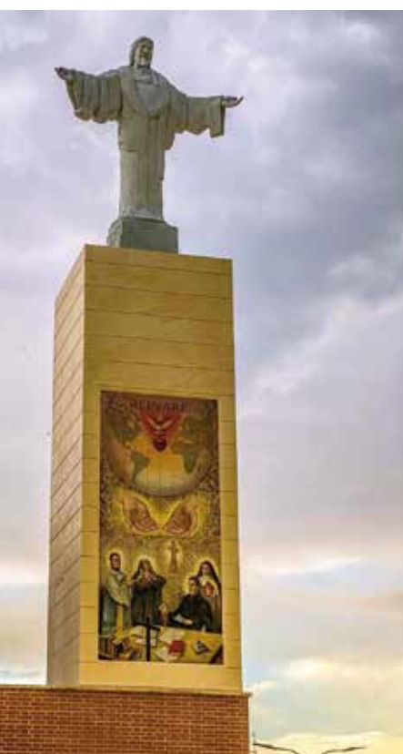
Corazón, en la torre de la parroquia talaverana.

Prosiguió la Santa Misa y, tras la comunión y la oración final, se expuso el Santísimo para delante de su Presencia recitar la oración de consagración.