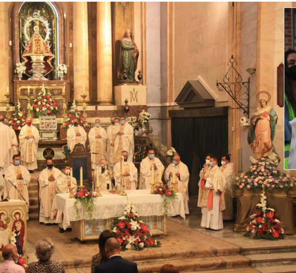
Consagración en la basílica del Prado, con las imágenes que bendijo el beato Saturnino Ortega. A la derecha, el relicario con una reliquia del beato.