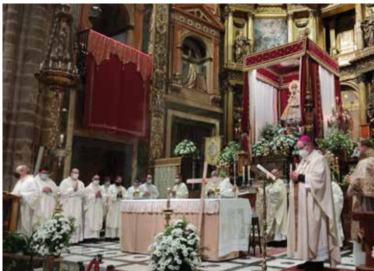
PADRE NUESTRO / 20 DE JUNIO DE 2021

Entre sus publicaciones: «Liturgia mozárabe y connotaciones temporales» (1983); «Ley del espíritu y ley moral en San Pablo» (1983); «Música y capellanes mozárabes» (1991). También publicó un estudio sobre las reliquias de Santa Eulalia. Para generaciones de sacerdotes fue en nuestra archidiócesis el querido profesor de Antiguo Testamento que les llevó a recorrer, con su sabiduría, los primeros libros de la Sagrada Escritura.