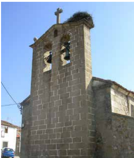
Iglesia de Nuño Gómez.

Así con su muerte anónima acabó sus días con el supremo acto de amor que es dar la