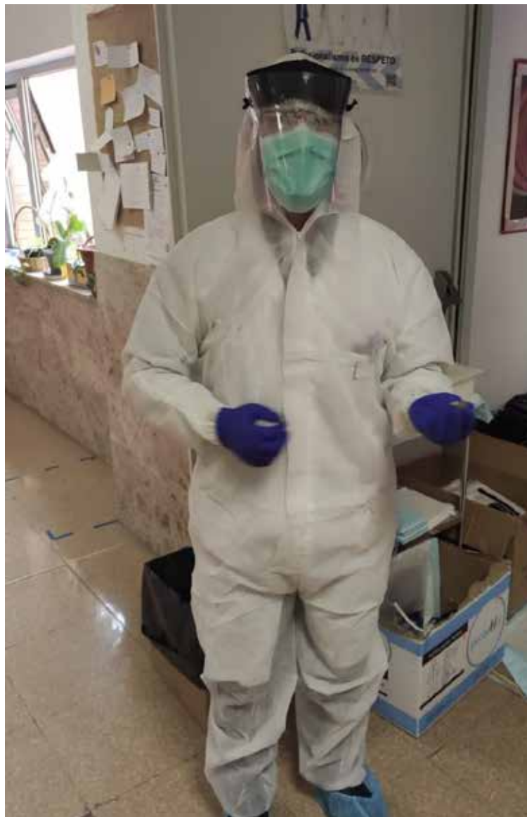
Un sacerdote en el hospital de Talavera de la Reina.

Los capellanes son los administradores de los sacramentos y están atentos a la necesidad espiritual de cada enfermo, acompañando y rezando por los pacientes contagiados. Una entrega que no solo llevan a cabo con los enfermos sino también con todos los profesionales sanitarios y de las residencias, porque tal y como expresaron encuentran en los sacerdotes su