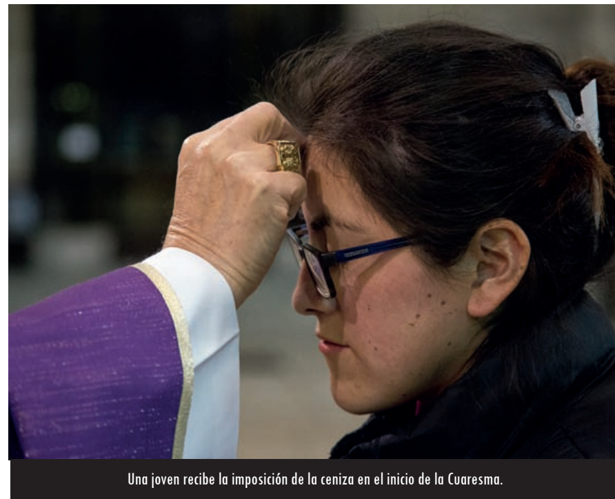
Una joven recibe la imposición de la ceniza en el inicio de la Cuaresma.

Otro aspecto a tener en cuenta es la importancia del ayuno en la Iglesia primitiva. El ayuno era una práctica muy común como signo de penitencia. Hasta el siglo VI existía en la Iglesia el orden de los penitentes que venía a ser como un grupo de penitentes que reconocían públicamente que habían cometido pecados graves y que durante 40 días previos a la Pascua se sometían a una serie de penitencias y renunciaciones, entre ellas vestir con sayal, cenizas en la cabeza y el ayuno prolongado. Sabemos que el 40 tiene un arraigado simbolismo peni-