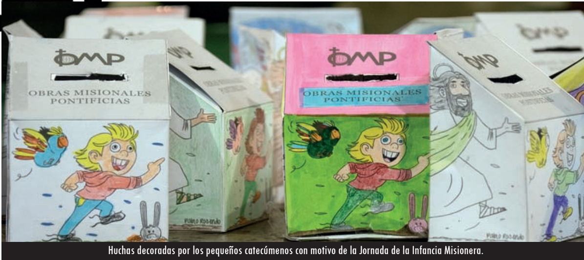
Huchas decoradas por los pequeños catecúmenos con motivo de la Jornada de la Infancia Misionera.