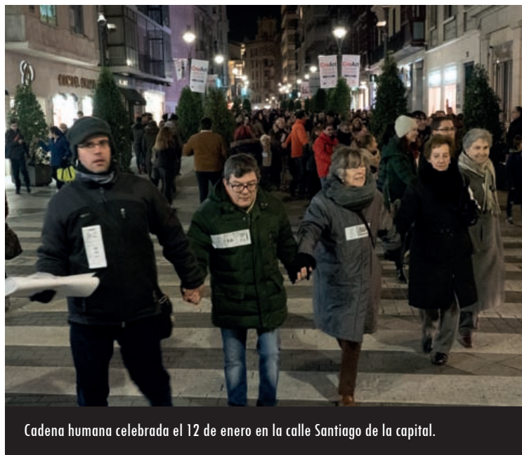
Cadena humana celebrada el 12 de enero en la calle Santiago de la capital.