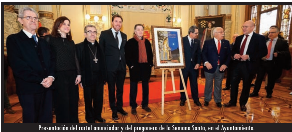
Presentación del cartel anunciador y del pregonero de la Semana Santa, en el Ayuntamiento.

Ha pronunciado pregones en diversas cofradías, como el Pregón Nazareno en 2006, el del Discípulo Amado en 2012 o el Ofrecimientos de los Dolores de la Santa Vera Cruz en 2007. Y en 2008 pronunció el pregón del Premio Valladolid Cofrade Pero no sólo la Semana Santa vallisoletana ha sido objeto de su labor, sino que también se ha ocupado de la de Medina del Campo, sobre la cual ha escrito el libro "Medina en el Corazón".