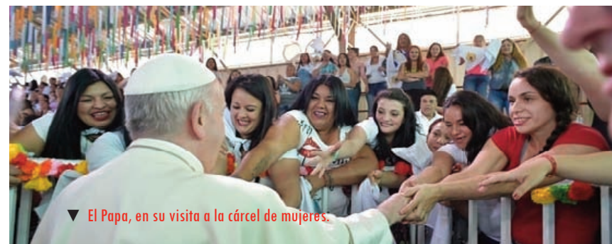
▼ El Papa, en su visita a la cárcel de mujeres.

Nadie es perfecto, por supuesto, pero que un Papa se corrija y agradezca las correcciones de un Cardenal no es cosa de todos los días.