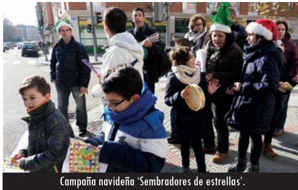
Campaña navideña 'Sembradores de estrellas'.

Esta preocupación misionera, que debe formar parte de la pastoral ordinaria, en determinados momentos se hace más presente en la vida de las comunidades, y así el mes de octubre está marcado por la jornada del Domund, y el de enero por la jornada de Infancia Misionera (28 de enero). Son dos