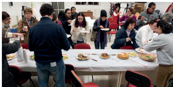
Eucaristía de la Jornada Mundial del Emigrante y el Refugiado (imagen superior) y comida intercultural organizada por Red Íncola (imagen inferior).

a la Delegación Diocesana de Migraciones y a Cáritas Diocesana, junto con otras ONG a convocar, el viernes anterior, 12 de enero, la formación de una gran cadena humana a favor de la acogida, hospitalidad y convivencia de los migrantes, en la línea del lema que la jornada ha tenido este año: ‘Acoger, proteger, promover e integrar a los emigrantes y refugiados’.