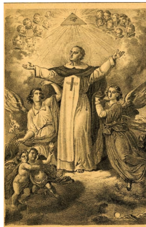
El trinitario San Miguel de los Santos.

Desde mediados de 1622, se trasladó al convento de los trinitarios descalzos de Valladolid, que entonces se encontraba establecido más allá del Puente Mayor