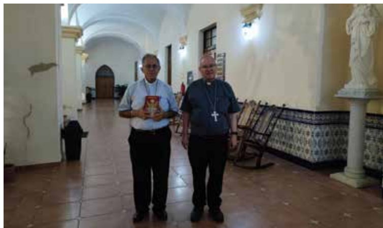
Con el arzobispo de La Habana, cardenal Juan de la Caridad.

El viaje ha sido un regalo de Dios, al poder compartir unos días en la diócesis de Cienfuegos y en La Habana, y comprobar que la Iglesia está presente para evangelizar y hacer el bien. Damos gracias a Dios por tantos misioneros que ponen sus vidas al servicio de la Iglesia y de los más pobres.