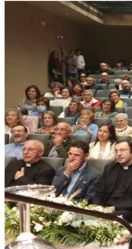
Voluntarios de Cáritas en Castilla-La Mancha, durante la presentación de la Memoria Regional de 2022.

308 técnicos contratados, 8.193 socios y donantes, así como los sacerdotes de cada una de las Cáritas Parroquiales de Castilla-La Mancha.