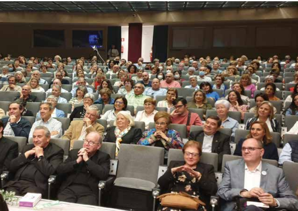
La última asamblea regional celebrada en Albacete.

dualizados, talleres formativos, prelaborales y/o desde las 6 empresas de inserción, 527 inserciones laborales con estas personas es un signo para la esperanza.