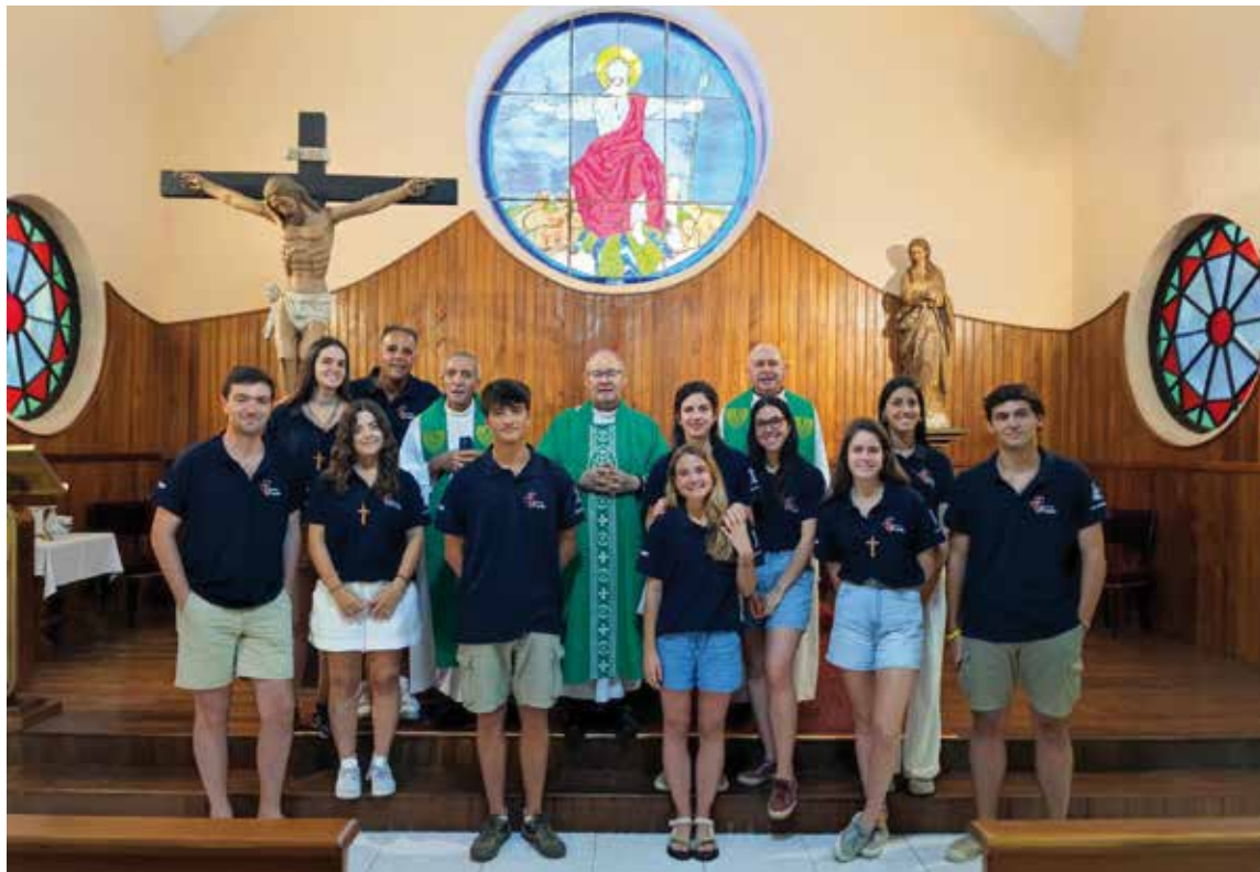
Con el obispo de Cienfuegos, el delegado de misiones y los jóvenes de nuestra archidiócesis que participan en «Verano Misión».