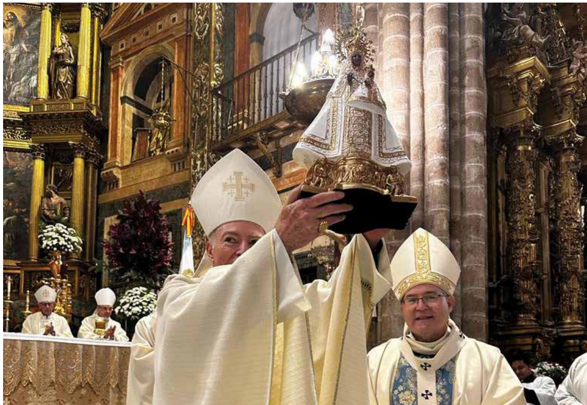
El cardenal Aguiar muestra la imagen de la Virgen de Guadalupe que le entregó el Sr. Arzobispo el pasado 13 de febrero.

HERMANAMIENTO DE LAS BASÍLICAS DE MÉXICO Y ESPAÑA