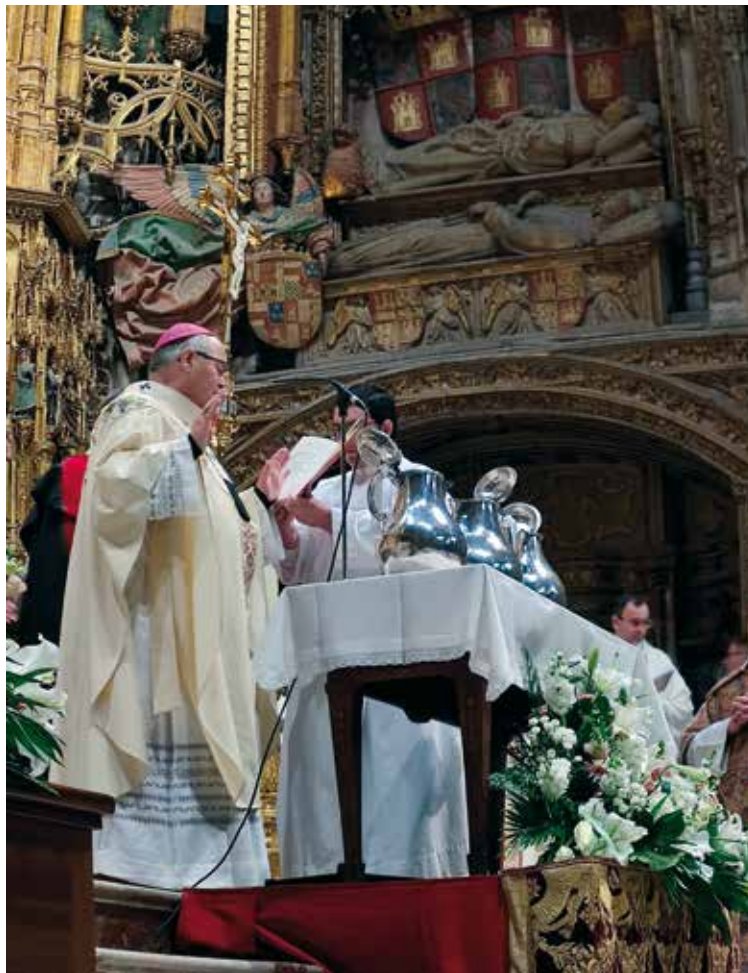
El Sr. Arzobispo consagró el Santo Crisma y bendijo los óleos.

En el escrito, el primado expresa su alegría cada año al «escribir estas líneas, de cora-