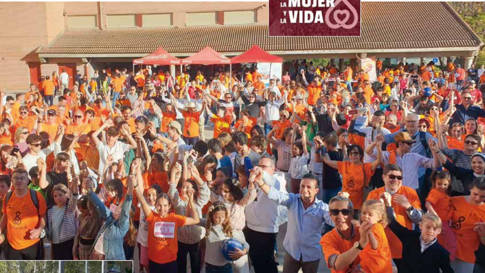
La Fiesta por la Mujer y la Vida del pasado año congregó a numerosos participantes.