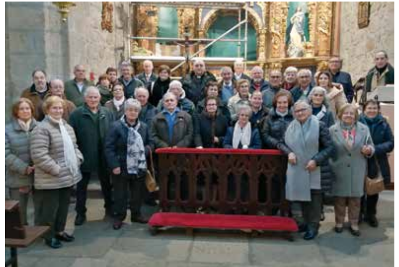
Algunos de los asistentes en encuentro de la Adoración Nocturna en Lagartera