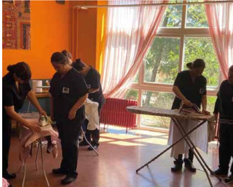
Curso de formación de Cáritas Diocesana.

Este gesto de marcar la «X solidaria» permite a Cáritas Diocesana recibir fondos que «hacen posible que podamos destinar