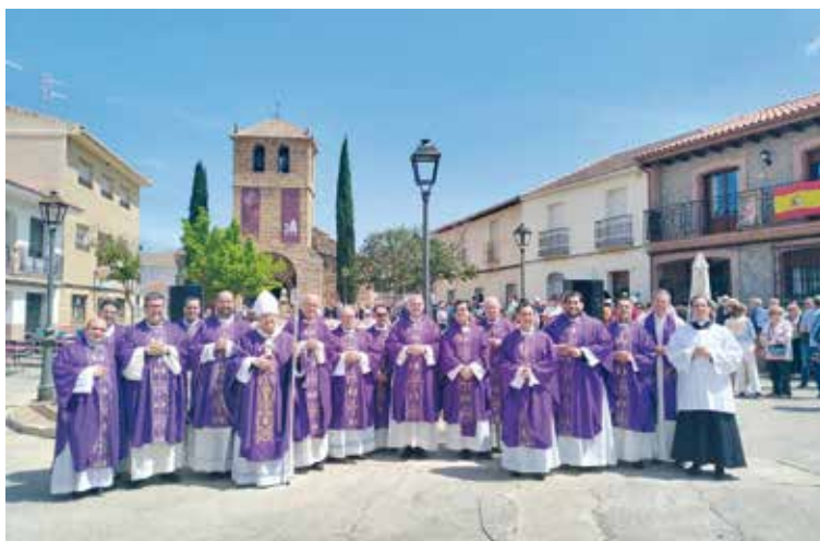
Los sacerdotes concelebrantes, junto al Sr. Arzobispo.