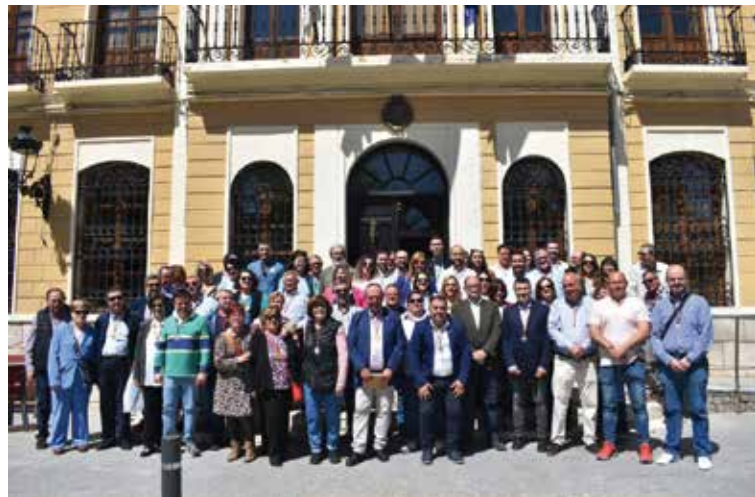
Los participantes en las jornadas.

La Rinconada de Tajo es un pueblo de colonización de la década de los años 50. Fueron alrededor de 54 familias quienes llegaron desde diferentes lugares de España y que se dedicaron a la agricultura.