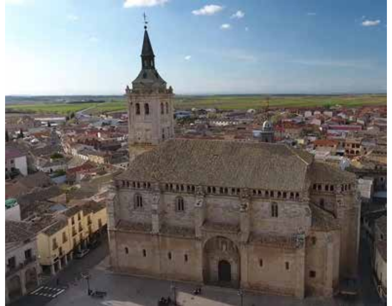
Vista aérea de la colegiata de San Benito Abad, de Yepes.

Fue construida por el arquitecto Alonso de Covarrubias y está declarada como Bien de Interés Cultural, con la categoría de monumento, desde 1992. Tiene planta de salón con tres naves abovedadas, tres capillas absidiales y doce capillas laterales. El templo está coronado por una torre de más de 60 metros, faro y punto de referencia en la Mesa de Ocaña. En su exterior destaca la monu-