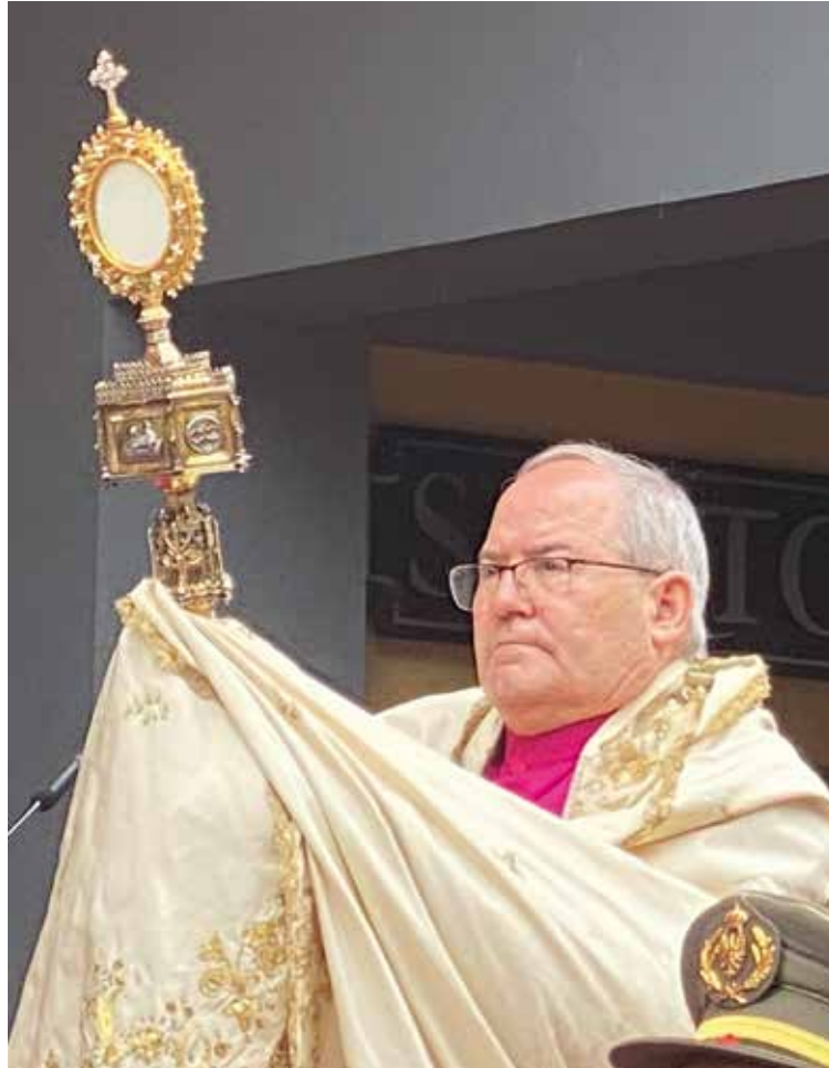
Bendición con el Santísimo en el Corpus Christi de Toledo.

«Al día siguiente —añade— el jueves 6, en Oropesa, subrayaremos la prolongación en la vida de la Iglesia de la celebración del misterio eucarístico, erigiendo el Santuario diocesano de Adoración y Reparación Eucarística ‘Cristo de la Salud’. El viernes 7 será la solemnidad del Sagrado Corazón de Jesús, y podremos meditar, adorar y reconciliarnos en el Santuario Diocesano de los Sagrados Corazones de Jesús y María, asistiendo también a la tradicional