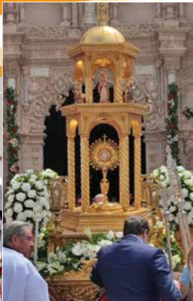
A la izquierda, Danzantes de Camuñas en la procesión del Corpus Christi. Arriba, la custodia con el Santísimo en el Corpus Christi de Torrijos. En la parte superior de la página el templo expiatorio de Oropesa.

Los actos concluirán con una Procesión Mariana, a las 18:30 h., desde la plaza del Cristo hasta el colegio diocesano «Santísimo Cristo de la Sangre», y con un concierto de Hakuna Toledo en el mismo lugar.