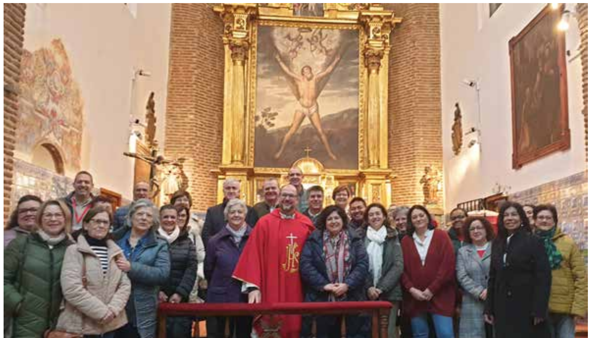
Algunos de los participantes en la Escuela de Talavera de la Reina. En la foto superior, los participantes en Toledo.

resaltando las ponencias con aspectos básicos de Cáritas Diocesana, la misión de Cáritas, los programas de la entidad, la protección de datos, la comunicación y la imagen, los derechos y deberes de los voluntarios, la protección de la