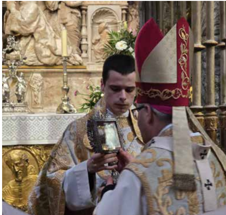
El Sr. Arzobispo besa la reliquia de san Ildefonso.

El Sr. Arzobispo comenzó su homilía definiendo a san Ildefonso como un pastor según el corazón de Señor. Luego se refería a tres aspectos de su