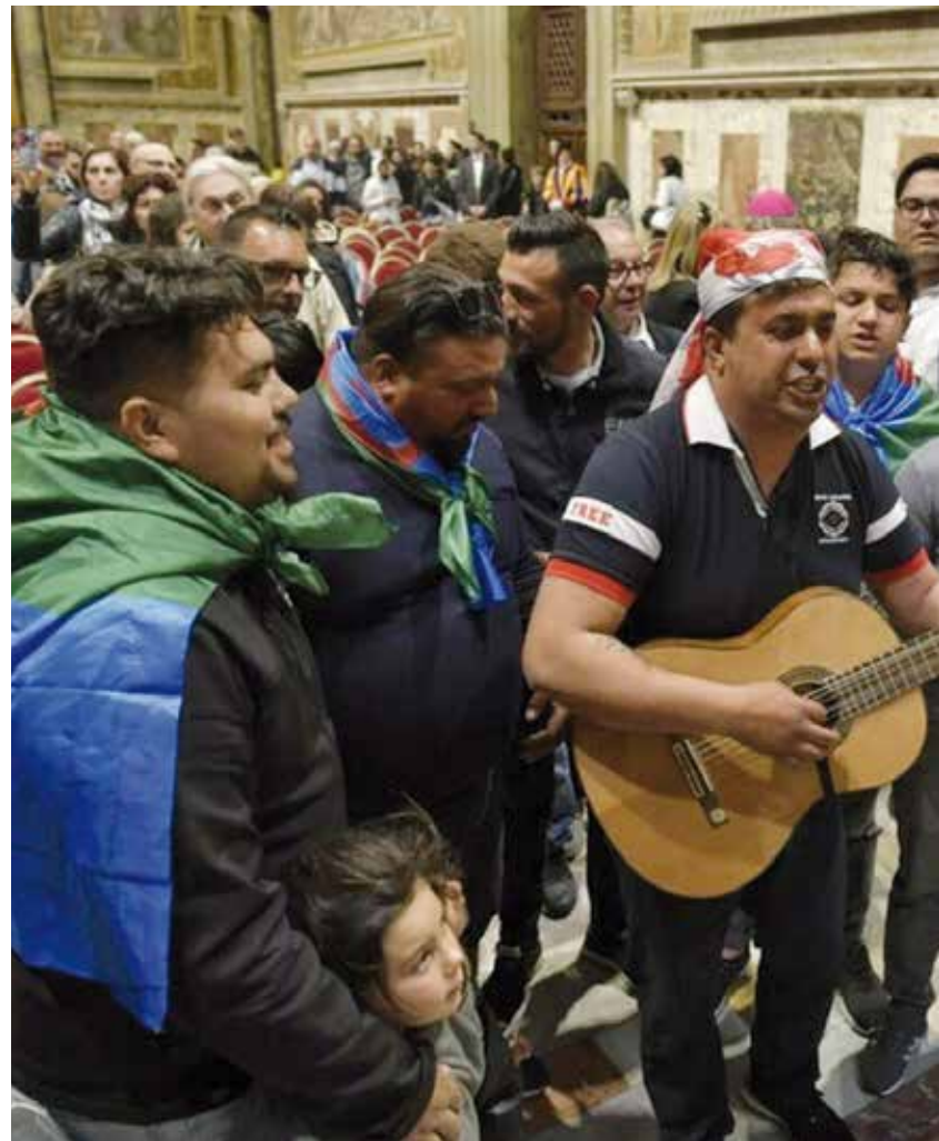
El Papa Francisco ha dirigido un mensaje al pueblo gitano en el sexto centenario de su llegada a España.

San Juan Pablo II, durante su pontificado, manifestó un profundo respeto y aprecio por