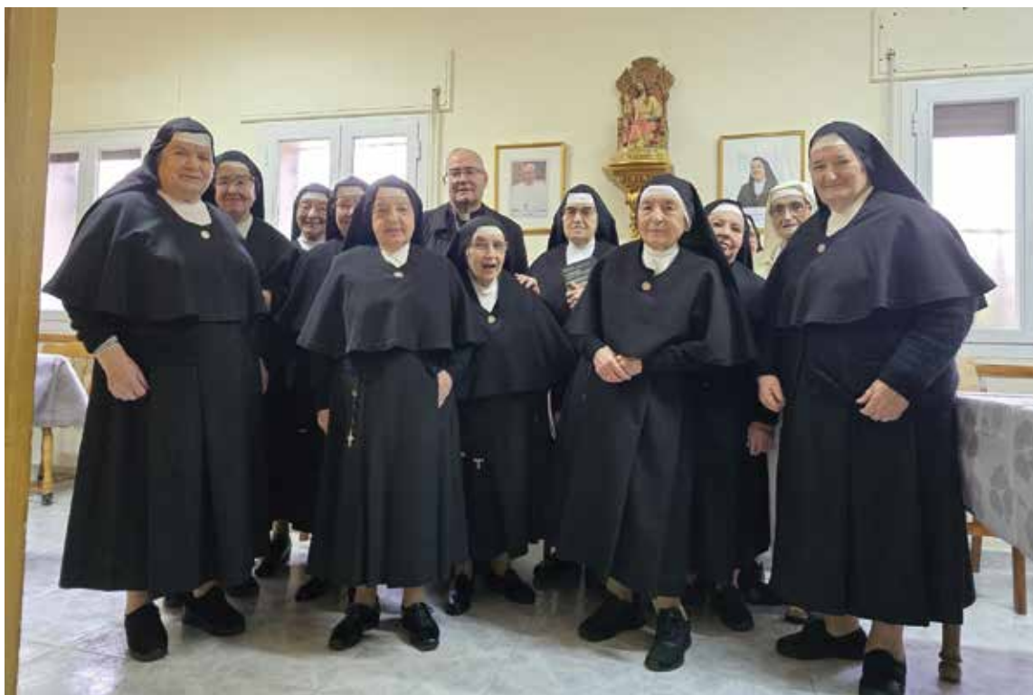
El Sr. Arzobispo en la visita a la comunidad de Siervas de María, en Talavera de la Reina

«La fiesta de la Presentación del Señor —añade— es un día estupendo para recordar al pueblo cristiano la belleza de la vida consagrada. También es una jornada propicia para dar gracias a Dios por la presencia de tantos hermanos y hermanas nuestros que, por la profesión de los consejos evangélicos, se han consagrado al Señor y con su labor hacen crecer el Reino de Dios desde el claustro o des-