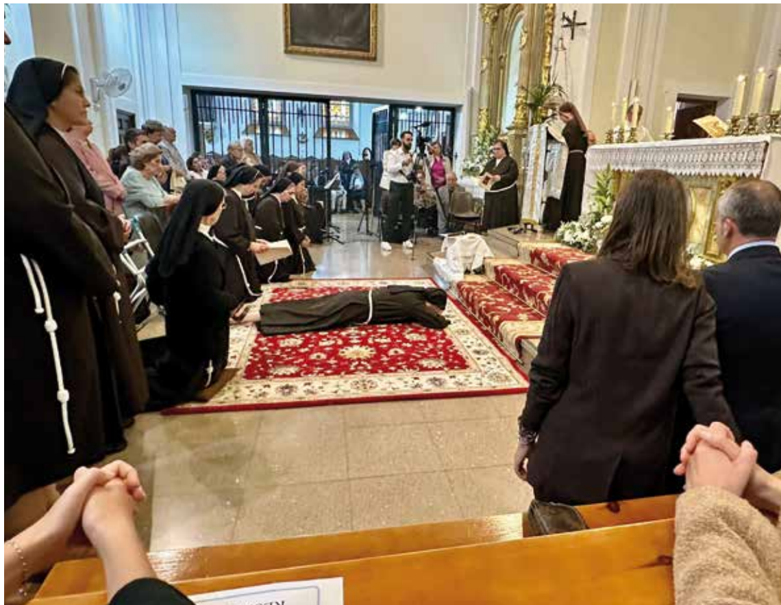
Profesión religiosa en el monasterio de monjas clarisas de Madridejos, el pasado año.

Este domingo, fiesta de la Presentación del Señor, es la Jornada de la Vida Consagrada, cuyas celebraciones centrales serán presididas por el Sr. Arzobispo, en la basílica de la Virgen del Prado, en Talavera de la Reina, a las 18:30 h., y por el Obispo auxiliar, en la catedral primada, a las 12:00 h. (PÁGINA 9)