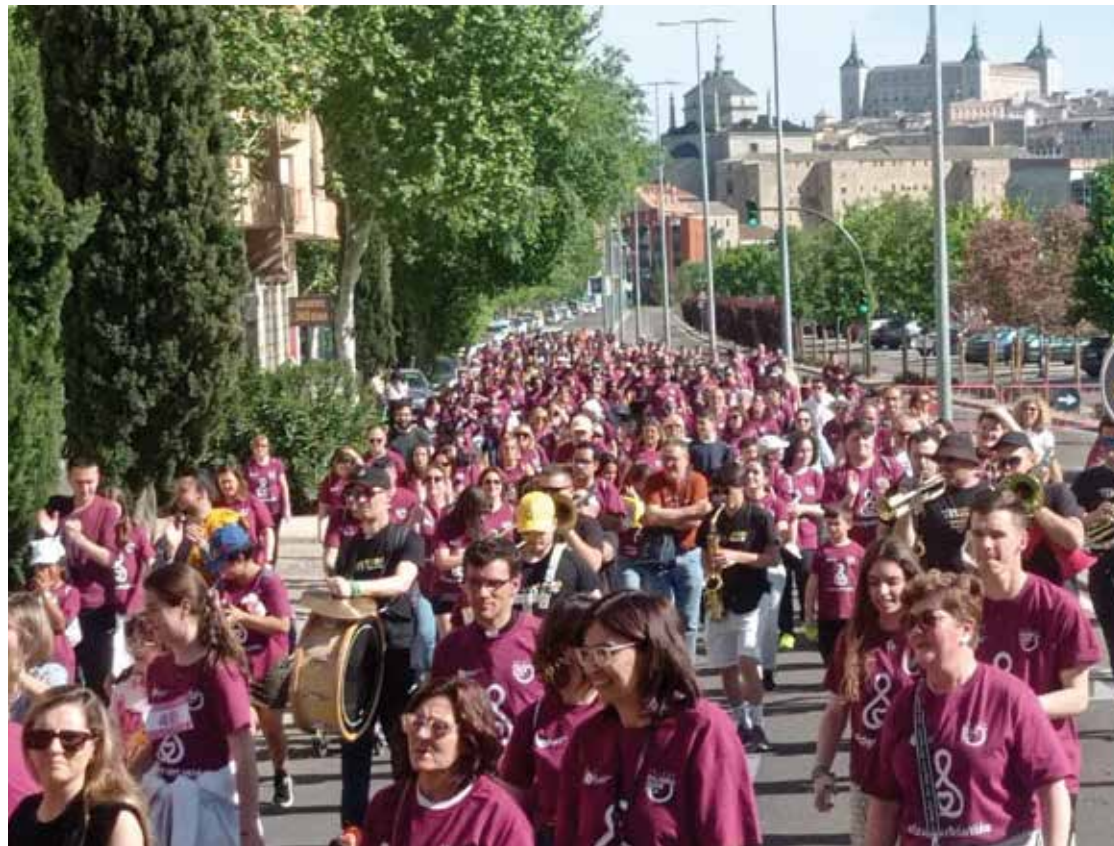
Marcha por la vida 2024.