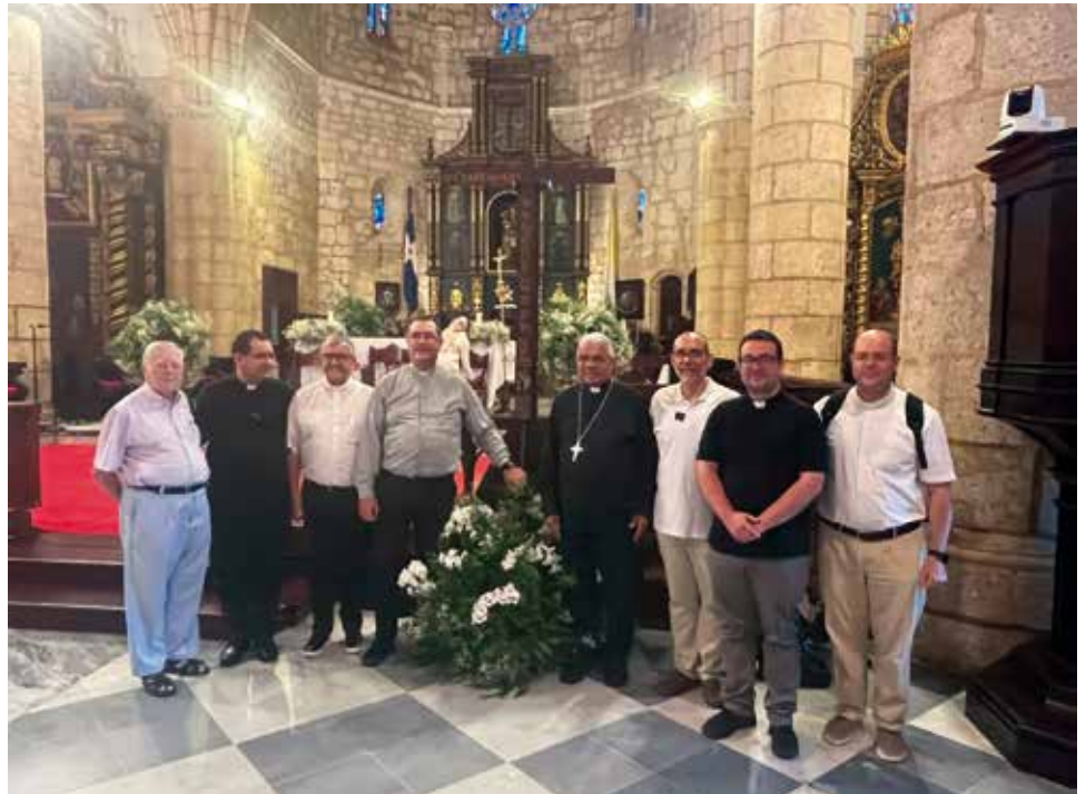
Sacerdotes diocesanos de Toledo participantes en el último encuentro de la OCSHA en República Dominicana.

En su mensaje para el Día de Hispanoamérica, el cardenal Robert Francis Prevost, presidente de la Pontificia Comisión para América Latina, recuerda que «la presencia de la Iglesia en el continente americano ha colaborado a hacer de los pueblos que lo integran 'historias de esperanza'. Cuando revisamos el camino recorrido, descubrimos con facilidad momentos de dificultad, de prueba y hasta de conflicto. Sin embargo —añade— una y otra vez, la fe cristiana ha introducido en el corazón de las personas y de las culturas algo que resulta irreductible al mero