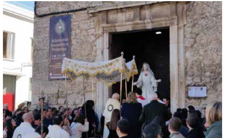
Llegada del Santísimo a la capilla.

que llegase este día de la adoración perpetua». Según explica Francisco Javier, «la Adoración Eucarística es la mejor forma de responder al amor de Jesús. El Señor al que adoramos es el Se-