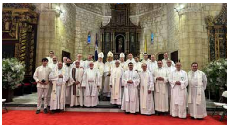
Sacerdotes españoles en Hispanoamérica durante su último encuentro continental.