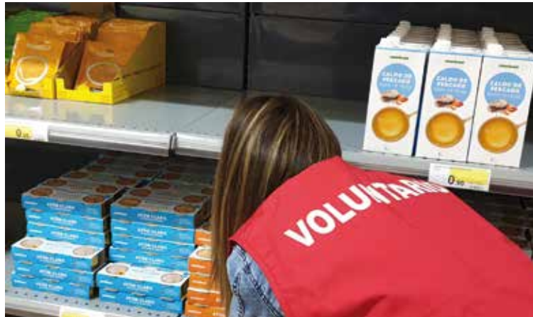
Una voluntaria repone alimentos en un economato de Cáritas Diocesana.

Hasta 2020 junto al centro «Beato Cardenal Sancha» estaban los economatos de Torrijos, Talavera de la Reina, Illescas y Oropesa. En la actualidad la red diocesana de economatos Proyecto COR_IESU está formada por 15 centros que, en 2024, atendieron a 869 familias al mes, beneficiándose más de 2.600 personas. Los economatos están en Yepes, Seseña, Sonseca, Torrijos, Ocaña, Con-