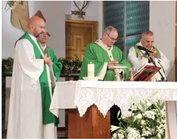
El Sr. Arzobispo con los concelebrantes y el diácono permanente.

Don Francisco comenzó la homilía saludando con cariño y afecto a todos los pacientes y los trabajadores del hospital, que «es referencia para Espa-