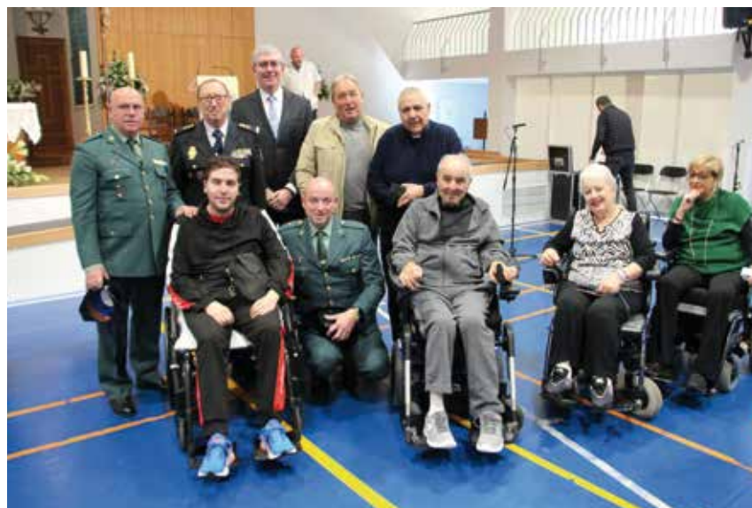
Algunas autoridades asistentes, con los responsables de pastoral de la carretera de la Conferencia Episcopal y de nuestra archidiócesis y con varios pacientes del Hospital.

mientos. Porque Jesús cree en la capacidad del corazón humano, que aún en su sufrimiento y su dolor puede ser feliz porque puede descubrir la alegría y el gozo de ser amado por Dios y de amar a los que Dios nos pone en el camino».