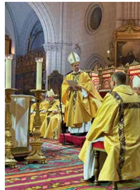
El Enviado del Papa durante la homilía de la sa del Rosario de Cristal, que ha sido restaurado

pero olvidamos cómo hablar con Dios; hemos conquistado distancias exteriores mientras se agrandan los desiertos interiores». Pero, en medio «de crisis del alma contemporánea», María «acompaña y anima la humanidad que sufre. Ella hace descender la esperanza sobre nuestros miedos, sobre