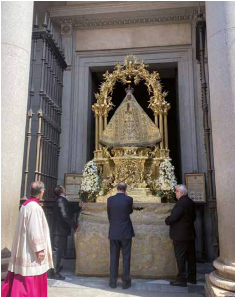
La Virgen del Sagrario sale por la puerta Llana de la catedral.

►►► anunciar la belleza del Evangelio en medio de un mundo en busca sentido, acompañar las heridas de la humanidad con la compasión de Cristo, y ser presencia humilde, pero firme, de una esperanza que no defrauda. Se trata de ofrecer una vida que hable, una Iglesia que acoja, una fe que ilumine».