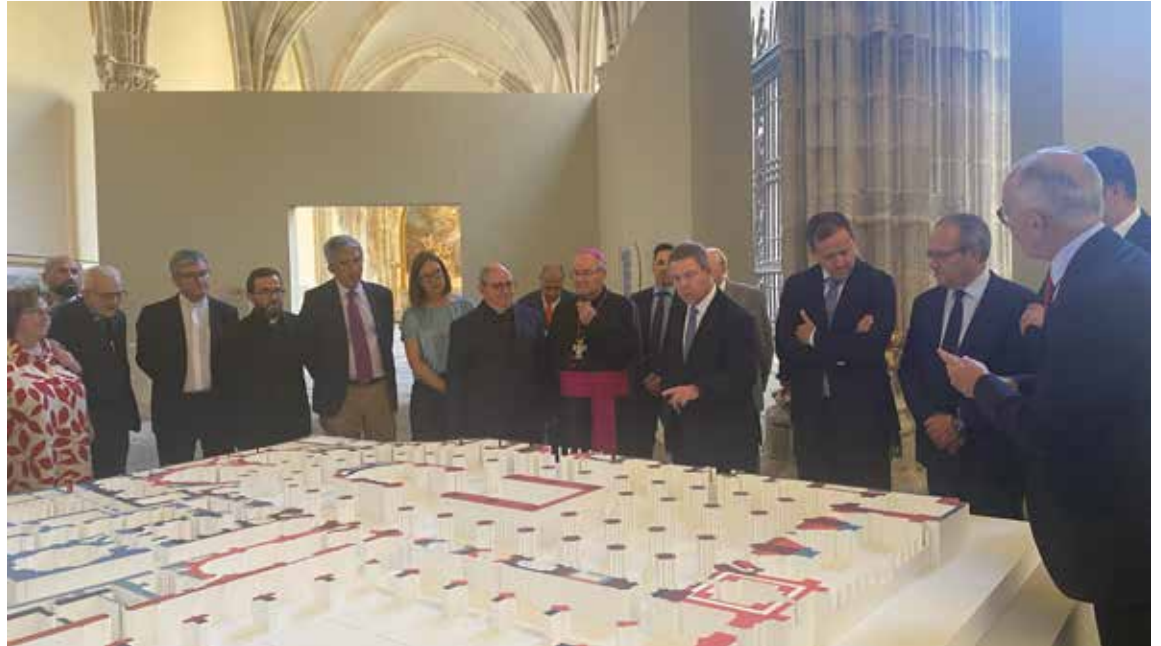
Una gran maqueta a escala de la planta de la catedral, en sus diferentes fases de construcción, recibe a los visitantes.

Dividida en dos grandes bloques cronológicos (desde el inicio de la construcción de