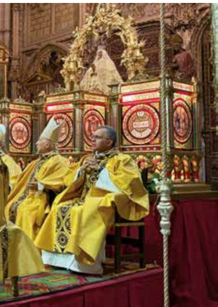
...ta misa, con los misterios gozosos ...con ocasión del centenario.

la incertidumbre de nuestro tiempo, sobre los sufrimientos que atravesamos, y nos asegura que el mal no prevalecerá, porque Dios mantiene siempre sus promesas y su misericordia es más fuerte que el mal».