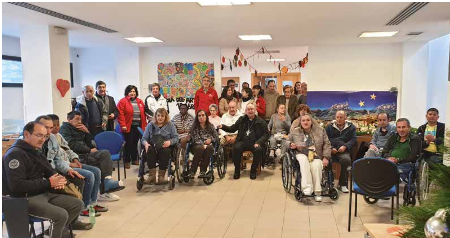
En el año 2025 el centro residencial Hogar 2000 atendió a 36 personas.