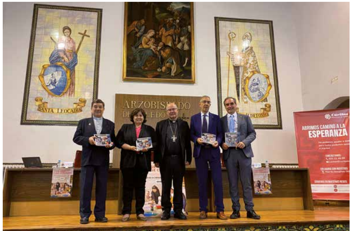
El Sr. Arzobispo, con el equipo directivo de Cáritas Diocesana tras la presentación de la Memoria del año 2025.

atender a 508 personas, frente a las 495 del ejercicio anterior. La entrada en vigor del nuevo reglamento de Extranjería disparó las consultas sobre el proceso de regularización de migrantes. En respuesta, Cáritas Diocesana priorizó y adaptó sus Escuelas de Acogida, ofreciendo formaciones específicas en valores constitucionales, igualdad de género y derechos, obligatorias para la obtención del Informe de Integración.