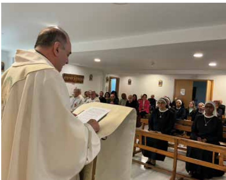
PADRE NUESTRO / 12 DE ABRIL DE 2026

La jornada concluyó con una cena conmemorativa de este centenario en la que el Sr. Arzobispo entregaba diversas placas de reconocimiento a todas las instituciones que han ido haciendo posible este proyecto social, educativo y evangelizador: el Ayuntamiento, la Fundación que rige el Santuario de la Caridad (FUNCAVE), los primeros profesores de la FP y las Hermanas Mercedarias.