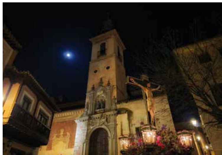
Visita a la Catedral Primada en su octavo centenario.

Esta línea de presencia tuvo continuidad inmediata en los días del triduo pascual. La Cofradía de la Santa Caridad acompañó en las celebraciones del Jueves Santo, el Viernes Santo y el Sábado Santo en el Centro Penitenciario Ocaña I, llevando al interior de la prisión el corazón mismo del Triduo Pascual. En los días centrales