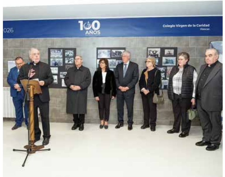
Inauguración de la exposición fotográfica.

Además, destacó que son esas mismas familias las que siguen demandando un tipo de formación para sus hijos en el marco de los valores cristianos. En este sentido, comparaba cada colegio diocesano como «una Betania», donde se cultiva la amistad con Cristo, la acción y la contemplación, realizando una contribución inestimable, aunque lenta y difícil, a nuestra