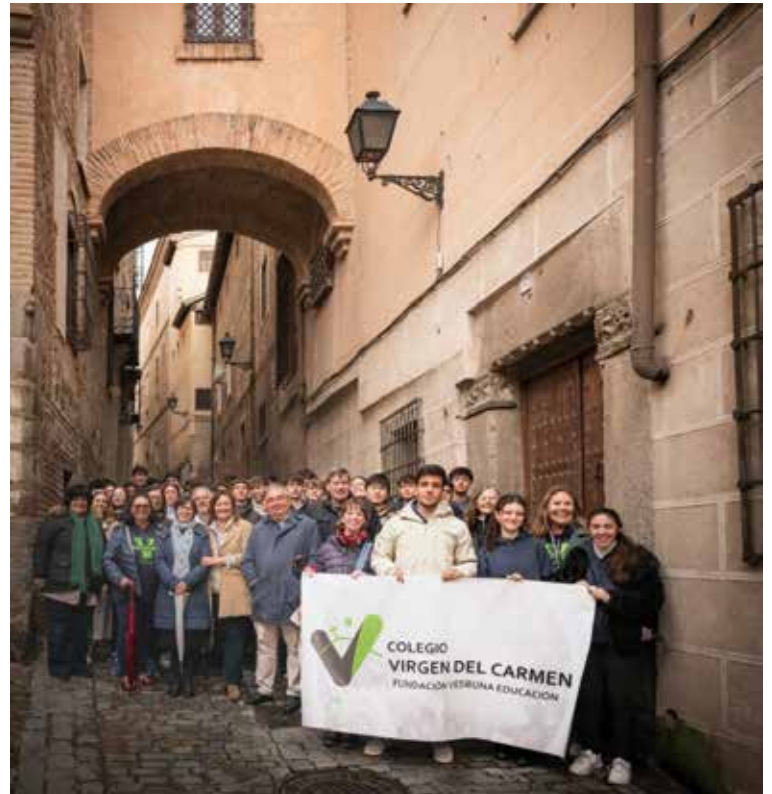
Un grupo ante el número 3 de la calle del Ángel.

La misa de acción de gracias estuvo presidida por el Sr. Arzobispo y concelebraron el obispo emérito de Segovia, don