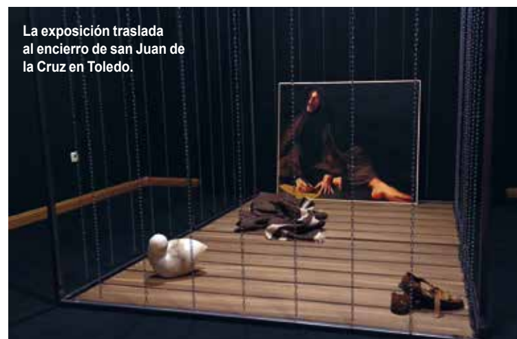
La exposición traslada al encierro de san Juan de la Cruz en Toledo.

¿Qué puede decir al hombre y a la mujer del siglo XXI un poema escrito en 1578 por un frailecillo pequeño y frágil? ¿Por qué artistas como Dalí, Amancio Prada, Estrella Morente, Oteiza, Carlos Saura... han bebido de él cómo fuente de inspiración de sus creacio-