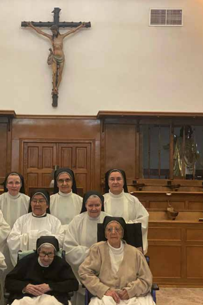
Comunidad del monasterio. A la izquierda, la misa de apertura del centenario.

de Talavera al llegar a nuestras «Benitas» se dice: «El monasterio de San Benito de religiosas del Cister es casa de mucha antigüedad, y se ignora su fundación; aunque hay autor que dice había convento del Cister en Talavera, en el reinado de Atanagildo, nombrando una religiosa de aquel tiempo que moraba en él. Ha habido y hay en dicho monasterio hijas de reyes, de grandes títulos y de caballeros particulares, a imitación del de las Huelgas de Burgos, y hoy están en él hijas de las familias más distinguidas de esta villa y otros pueblos».