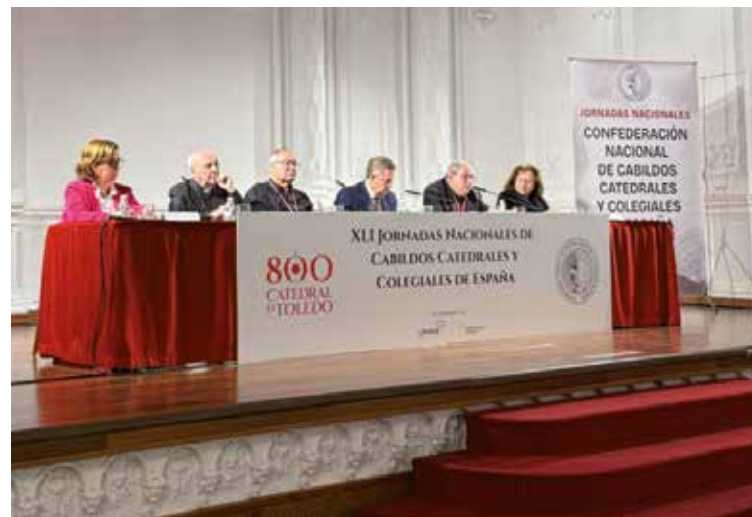
Las autoridades asistieron al acto de apertura de las jornadas.

Por su parte, el presidente de la Junta de Comunidades de