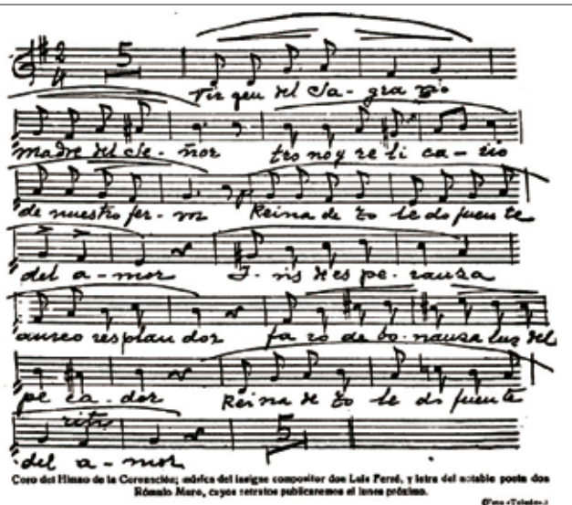
Coro del Himno de la Coronación; música del insigne compositor don Luis Ferré, y letra del notable poeta don Rómulo Muro, cuyos retratos publicaremos en las próximas.