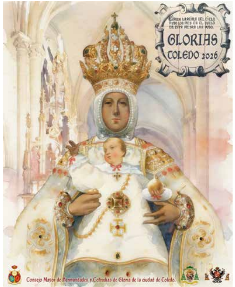
El cartel anunciador

La composición sitúa la escena en la capilla de la Descensión, bajo las naves catedralicias, un espacio de gran contenido simbólico vinculado al origen del templo y a la tradición mariana toledana. La tipografía, inspirada en el azulejo que conmemora la visita de la Virgen a la Catedral, refuerza el vínculo entre la ciudad, su historia y su devoción. El tratamiento en acuarela aporta luminosidad a la obra, evocando el espíritu de