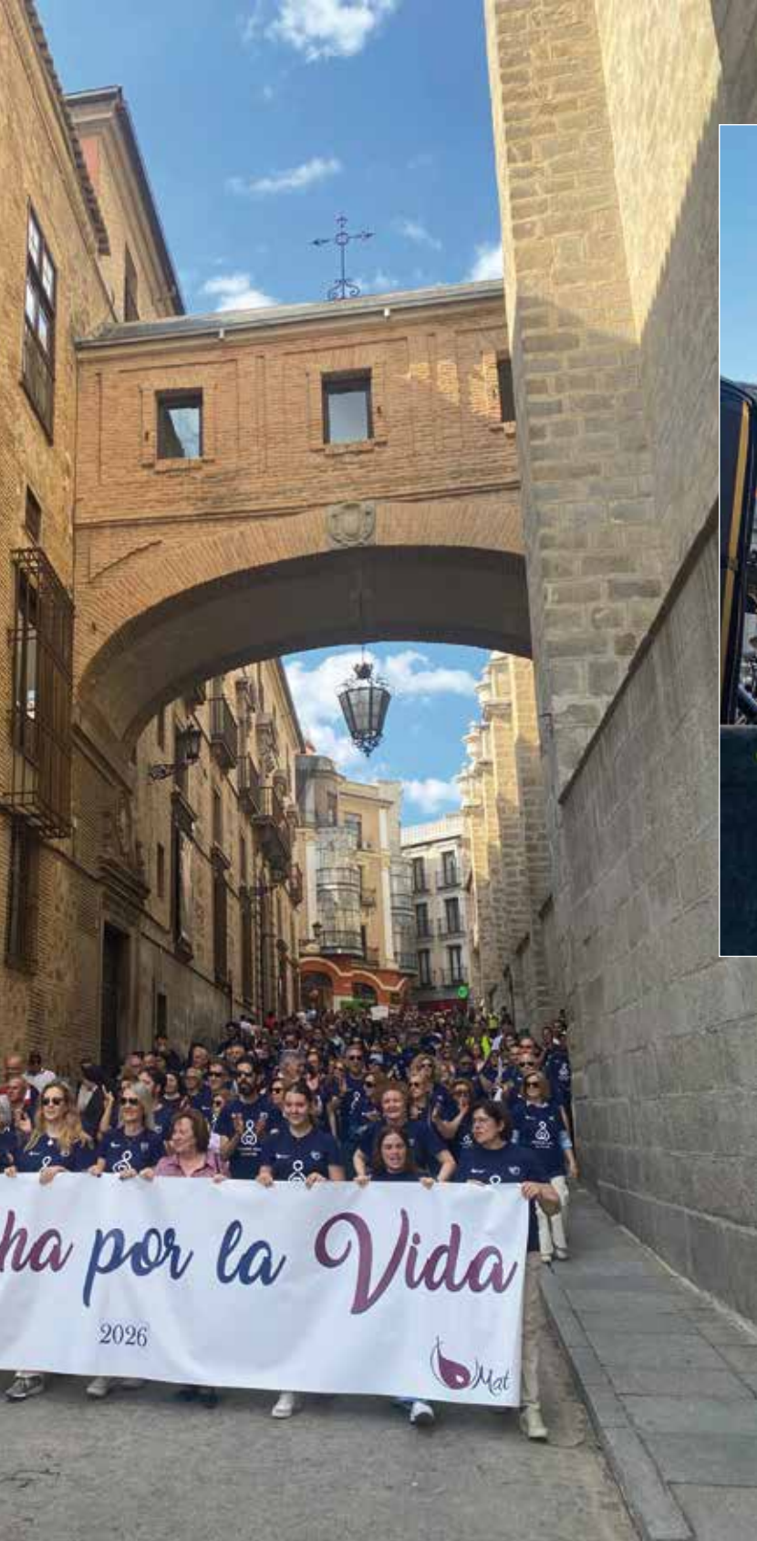
participantes en la marcha en la bajada del Arco de Palacio.

co dijo que «la vida es el mayor don que nos ha dado Dios y defender la vida humana merece la pena». En este sentido señaló que «Proyecto Mater, que tantas vidas ha salvado en estos años, es uno de los proyectos más luminosos de la archidiócesis de Toledo». Al finalizar la eucaristía, el Sr. Arzobispo bendijo a las madres embarazadas presentes y concluyó con una fotografía en el altar mayor con